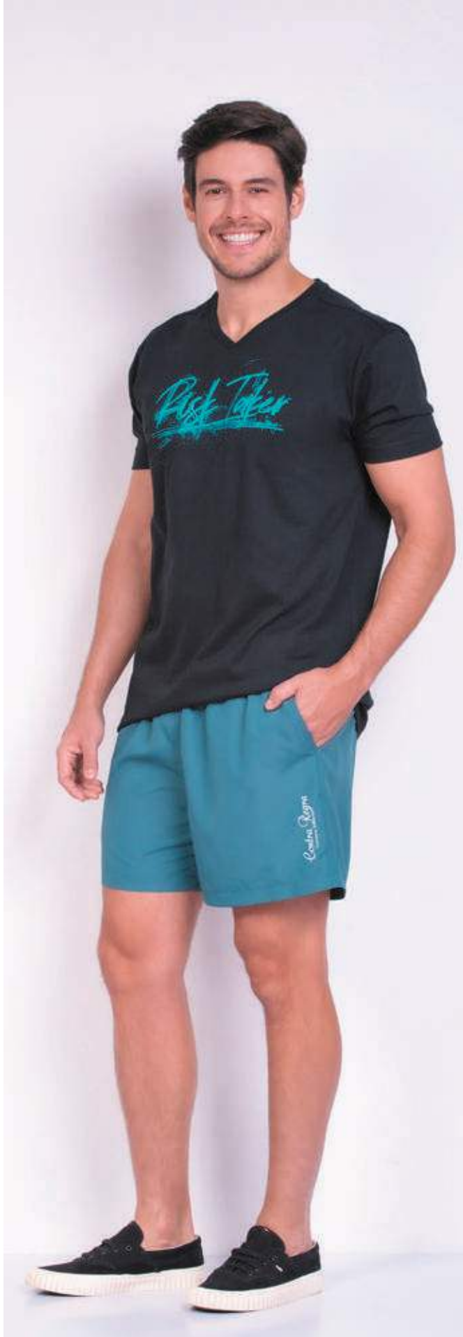
REF. 1557 CAMISETA TRADICIONAL GOLA V MEIA MALHA 100% ALGODÃO TAM. P AO S8