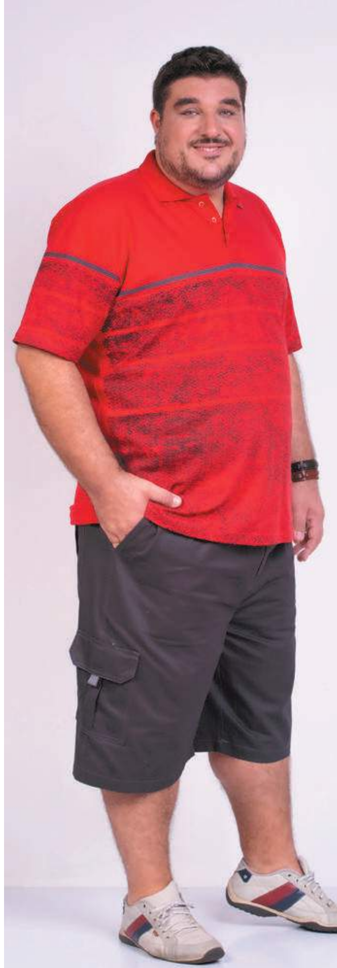
REF. 3369 CAMISETA POLO TRADICIONAL PIQUET 98% ALGODÃO 02% ELASTANO TAM. P AO S5