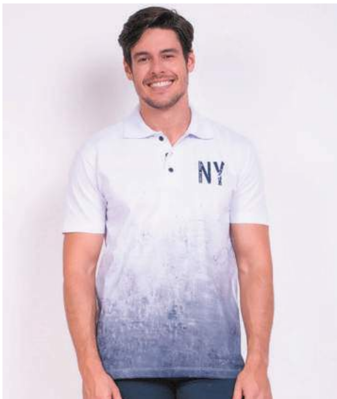
REF. 3382 CAMISETA POLO TRADICIONAL MEIA MALHA 100% ALGODÃO TAM. P AO S8