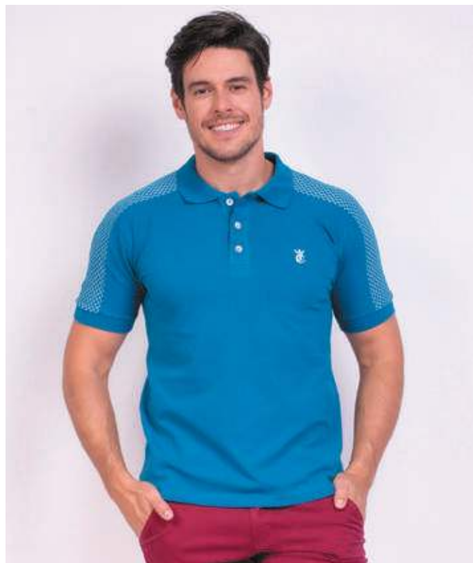
REF. 3101 CAMISETA POLO STREET PIQUET 98% ALGODÃO 02% ELASTANO TAM. P AO GG