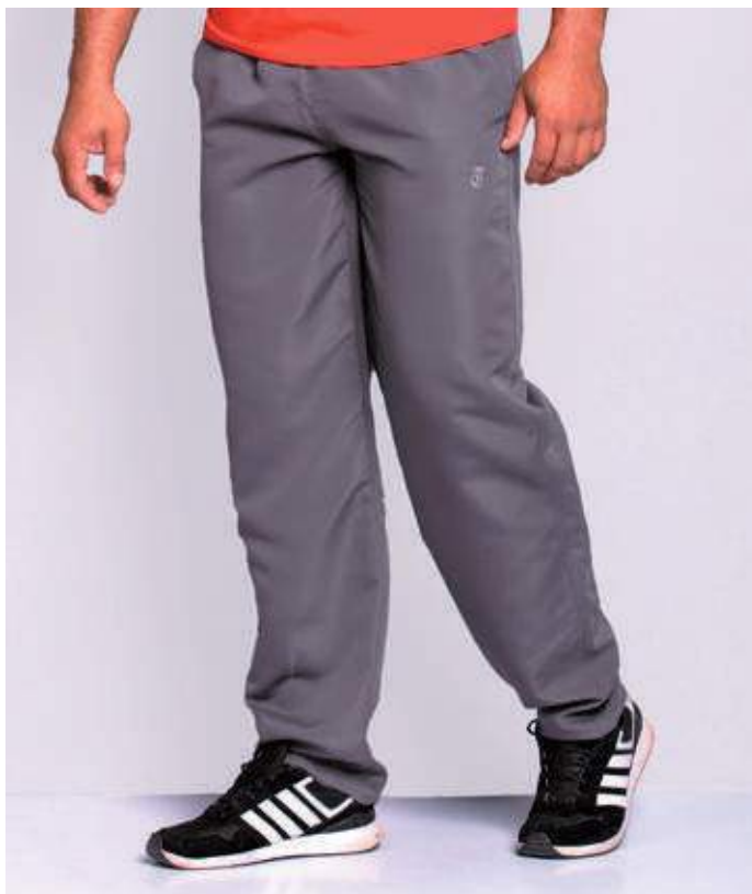
REF. 163 CALÇA DE ELÁSTICO MICROFIBRA 100% POLIÉSTER TAM. 02 AO S10