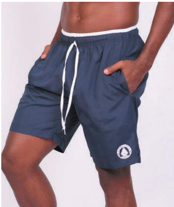
REF. 488 BERMUDA MAIS CURTA DE ELÁSTICO EXCIM 100% POLIÉSTER TAM. P AO S8