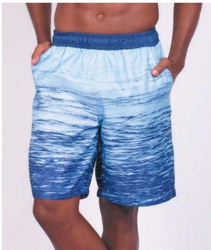
REF. 501 BERMUDA MAIS CURTA DE ELÁSTICO MICRO SARJA 100% POLIÉSTER TAM. P AO S3