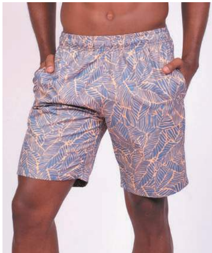
REF. 463 SHORTS DE ELÁSTICO MICRO FIBRA ESTAMPADA 100% POLIÉSTER TAM. P AO S8