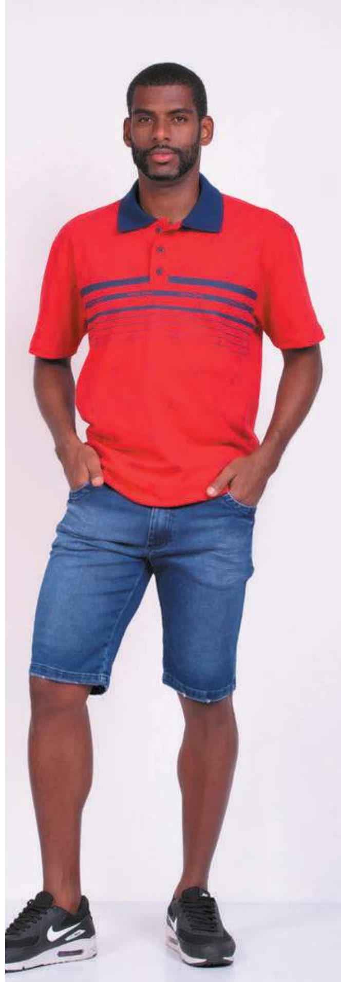
REF. 3378 CAMISETA POLO TRADICIONAL PIQUET 98% ALGODÃO 02% ELASTANO TAM. P AO S5