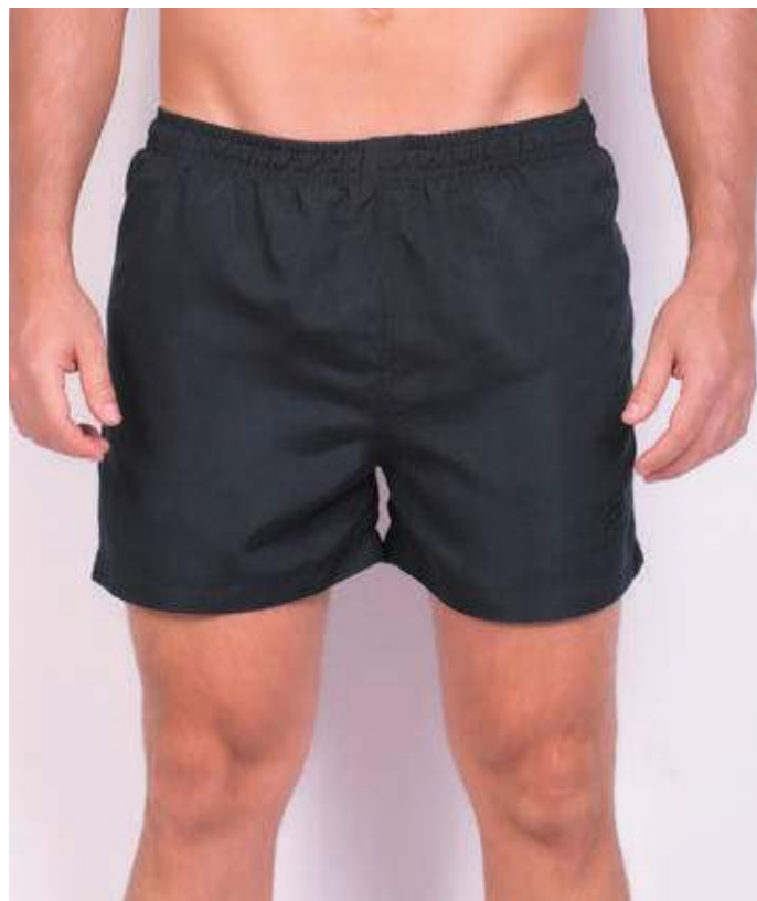
REF. 60 BERMUDA MAIS CURTA DE ELÁSTICO MICRO FIBRA 100% POLIÉSTER TAM. P AO S8