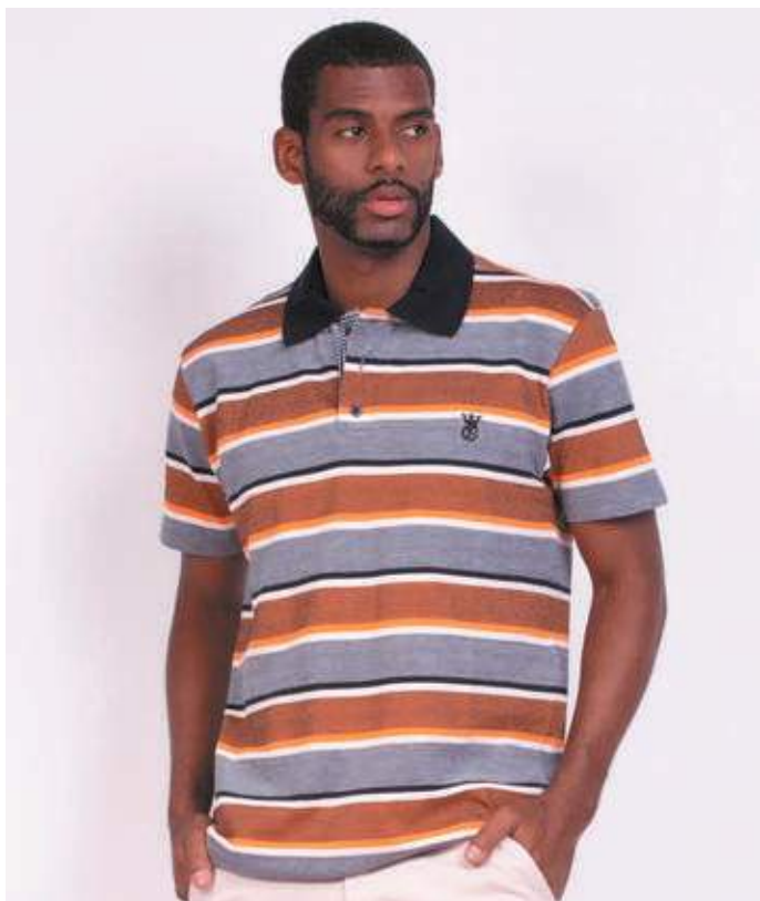
REF. 3336 CAMISETA POLO TRADICIONAL PIQUET 98% ALGODÃO 02% ELASTANO TAM. P AO GG