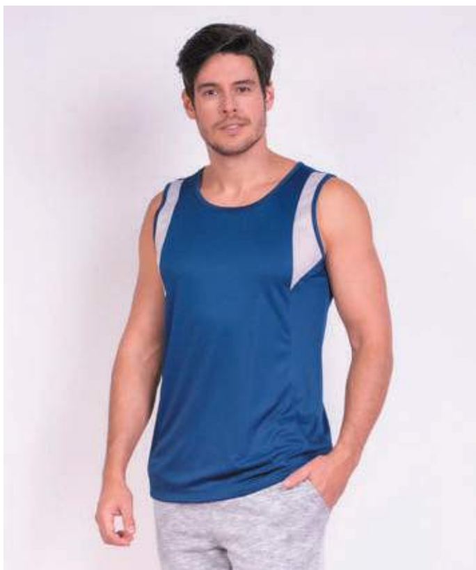
REF. 4461 CAMISETA REGATA TRADICIONAL HELANCA 100% POLIÉSTER TAM. P AO S5