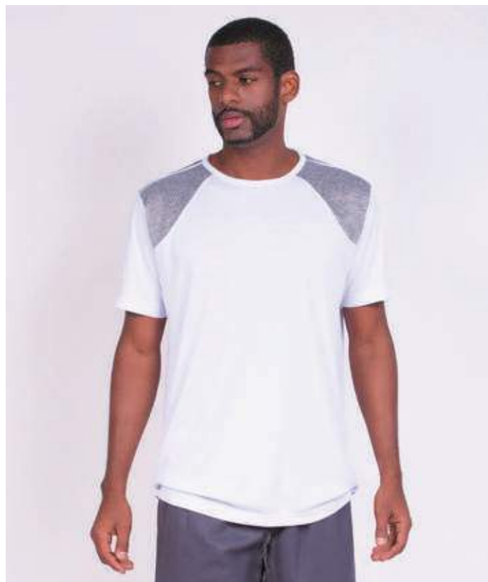
REF. 1547 CAMISETA TRADICIONAL HELANCA 100% POLIÉSTER TAM. P AO S3