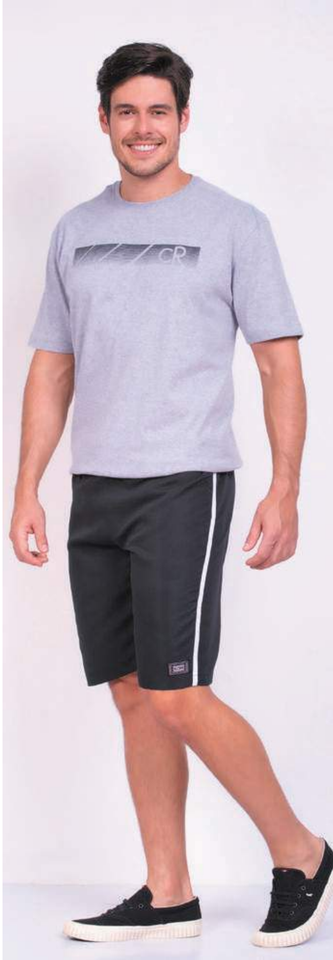
REF. 1561 CAMISETA TRADICIONAL MEIA MALHA 100% ALGODÃO TAM. P AO S5