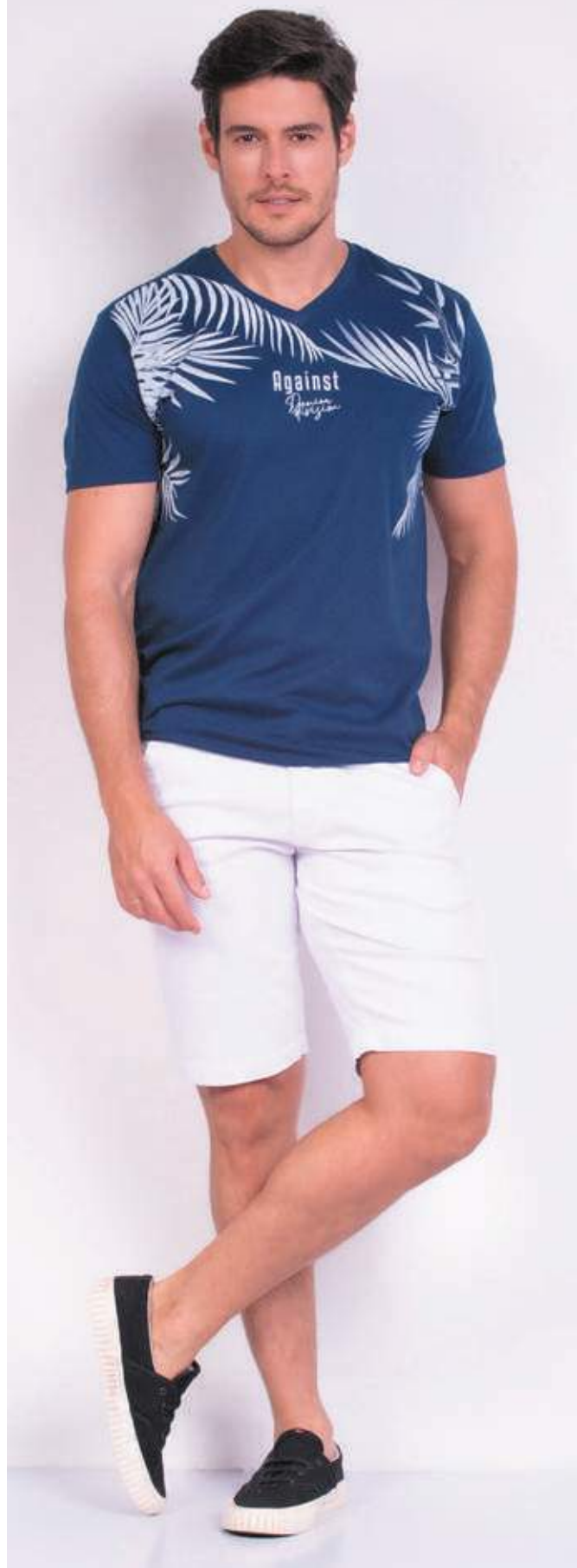
REF. 1810 CAMISETA GOLA V TRADICIONAL MEIA MALHA 100% ALGODÃO TAM. P AO S5