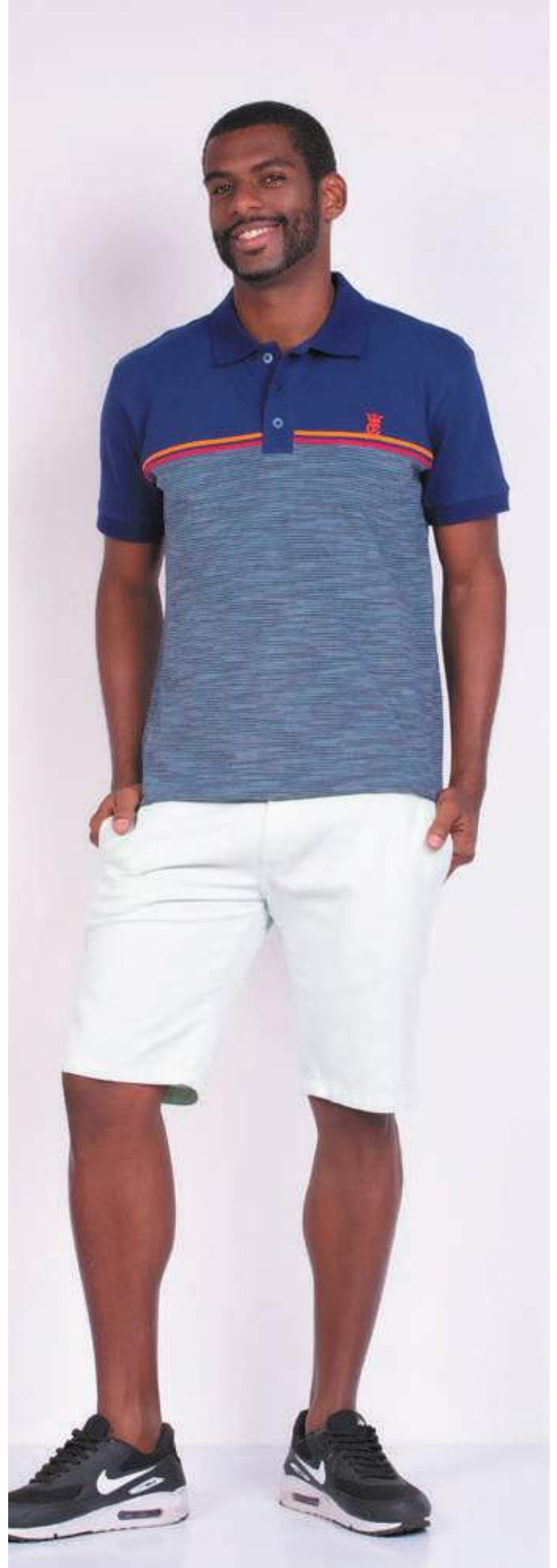
REF. 3314 CAMISETA POLO STREET PIQUET MEMÓRIA 96% ALGODÃO 04% ELASTANO TAM. P AO GG