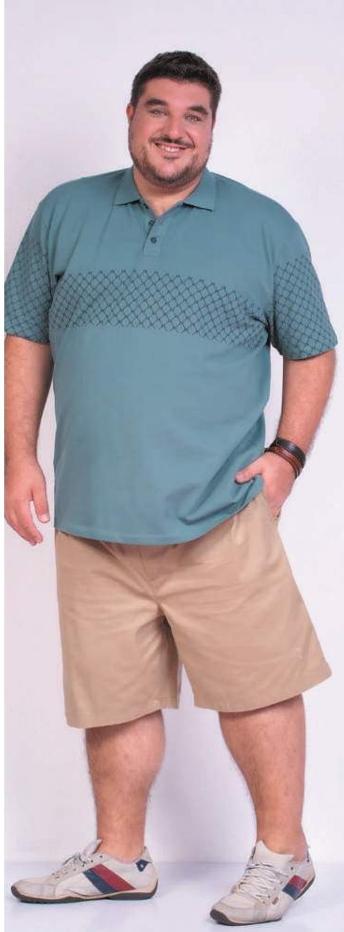
REF. 3368 CAMISETA POLO TRADICIONAL PIQUET 98% ALGODÃO 02% ELASTANO TAM. P AO S5