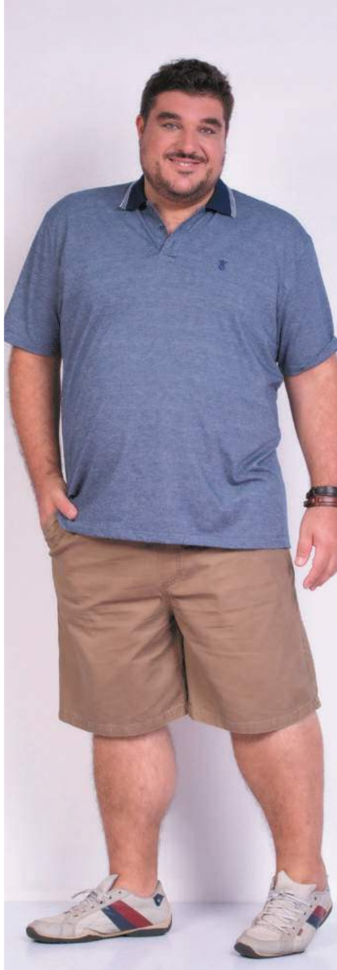
REF. 3375 CAMISETA POLO TRADICIONAL PIQUET 52% ALGODÃO 48% POLIÉSTER TAM. P AO S8