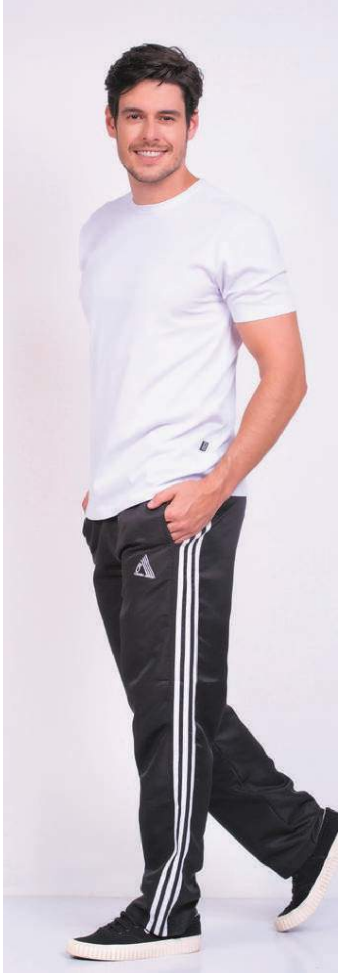
REF. 1220 CAMISETA TRADICIONAL MEIA MALHA 100% ALGODÃO TAM. 04 AO S10