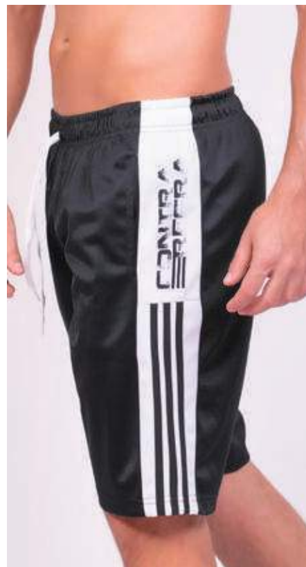
REF. 539 BERMUDA DE ELÁSTICO HELANCA 100% POLIÉSTER TAM. P AO S5