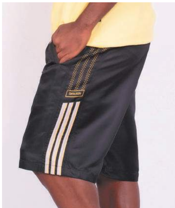
REF. 525 BERMUDA DE ELÁSTICO MICRO SARJA 100%POLIÉSTER TAM.: P AO S5