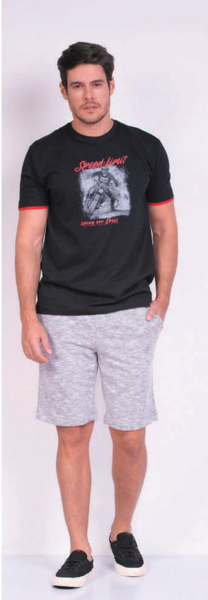
REF. 1572 CAMISETA TRADICIONAL MEIA MALHA 100% ALGODÃO TAM. P AO S5