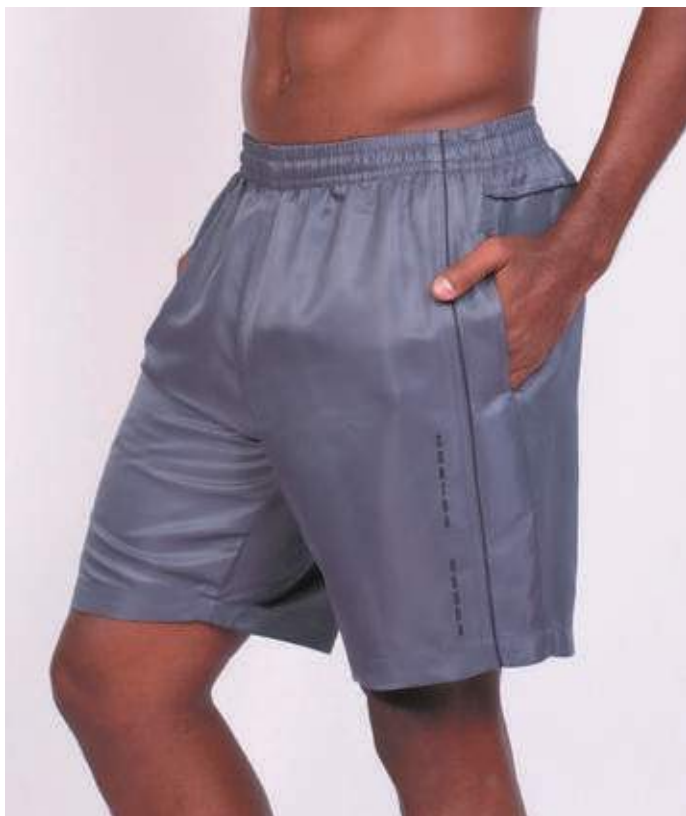
REF. 424 BERMUDA MAIS CURTA DE ELÁSTICO MICRO SARJA 100% POLIÉSTER TAM. 04 AO S8