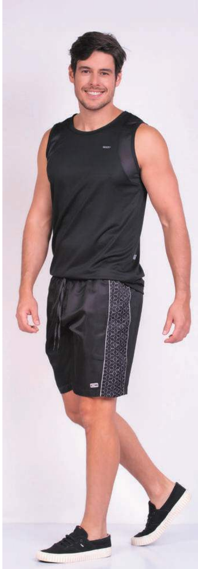
REF. 4460 CAMISETA REGATA TRADICIONAL DRY 100% POLIÉSTER TAM.: P AO S5