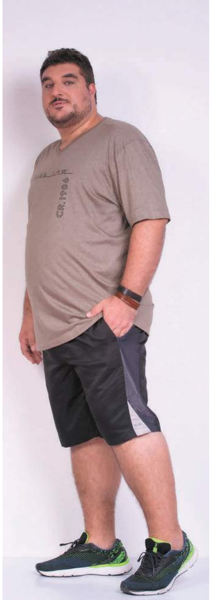
REF. 1552 CAMISETA TRADICIONAL GOLA V SENSATION 62% ALGODÃO 38% POLIÉSTER TAM. P AO S8