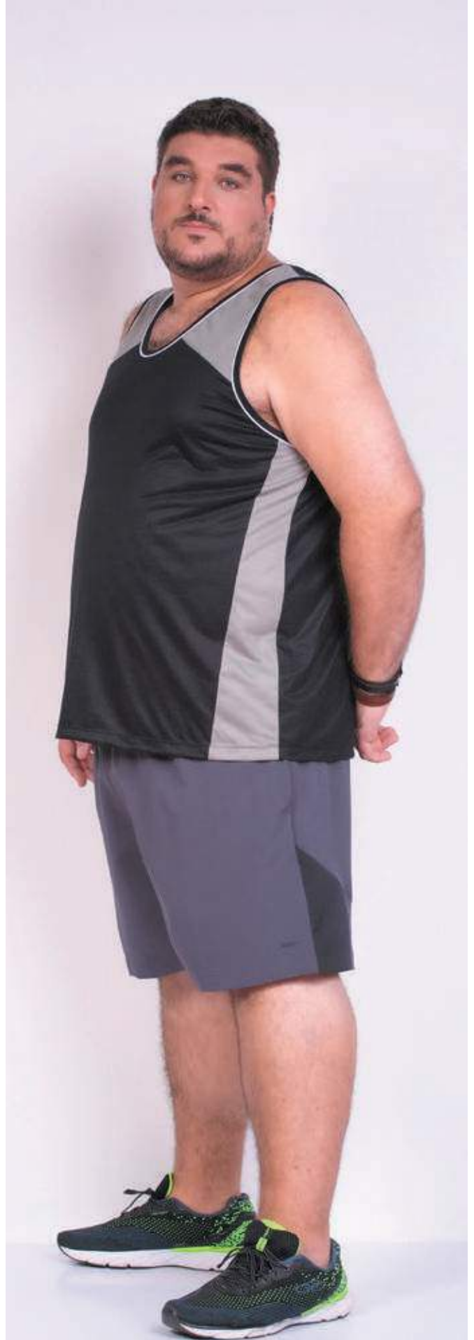
REF. 4413 CAMISETA REGATA STREET PV 65% POLIÉSTER 35% VISCOSE TAM. P AO S8