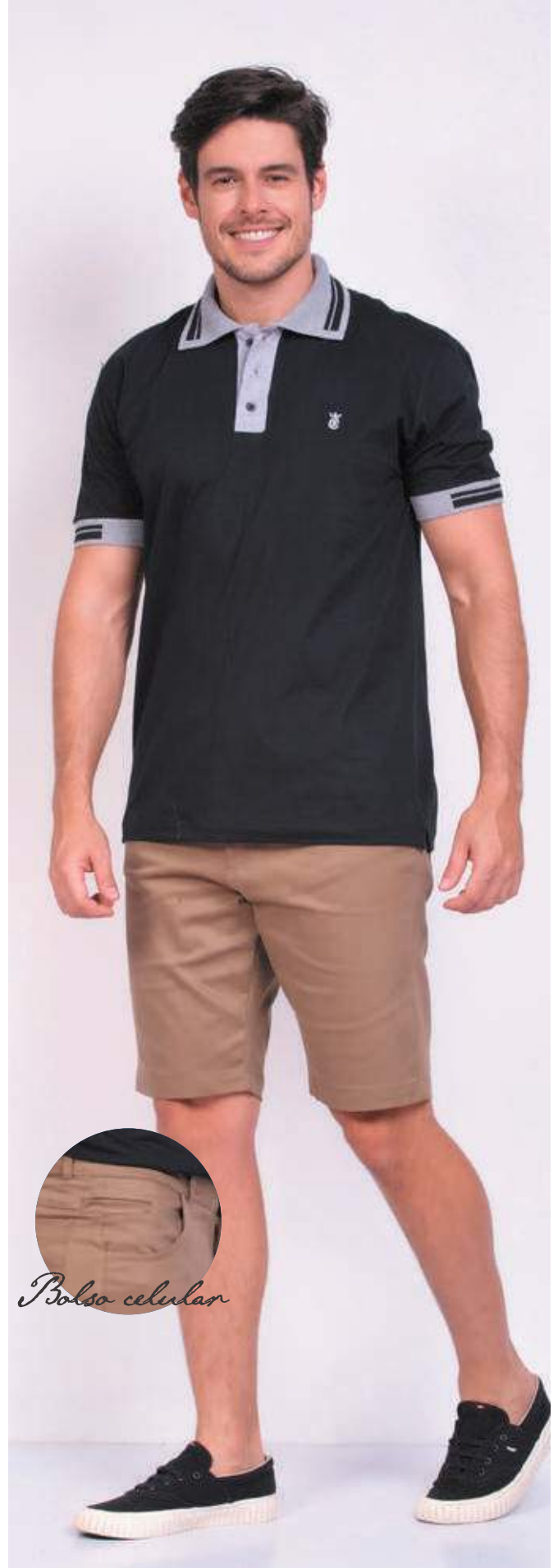
REF. 3380 CAMISETA POLO TRADICIONAL MEIA MALHA 100% ALGODÃO TAM. P AO S8