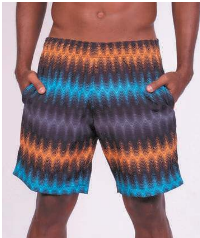
REF. 453 SHORTS MAIS COMPRIDO HIDRONAUTIC SPLASH 95% POLIÉSTER 05% ELASTANO TAM. P AO S5