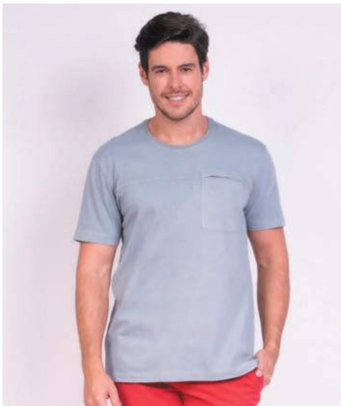
REF. 1809 CAMISETA TRADICIONAL MALHA PT 100% ALGODÃO TAM. P AO S5