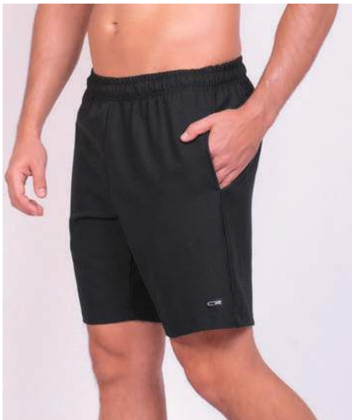
REF. 594 BERMUDA MAIS CURTA DE ELÁSTICO DIAMOND FLEX 92% POLIÉSTER 08% ELASTANO TAM. P AO S5