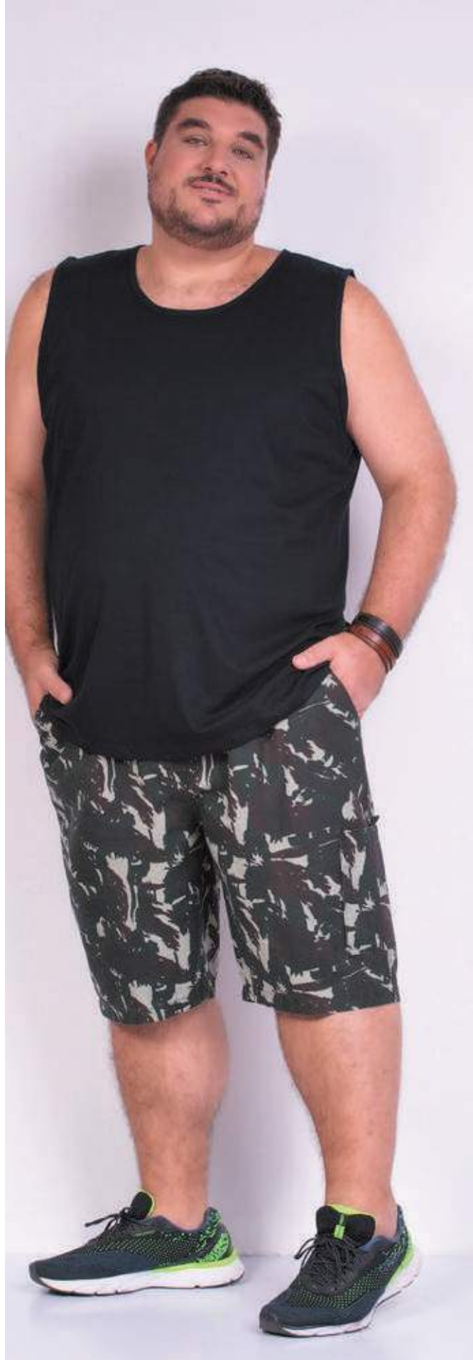
REF. 4422 CAMISETA REGATA TRADICIONAL MEIA MALHA 100% ALGODÃO TAM. P AO S8