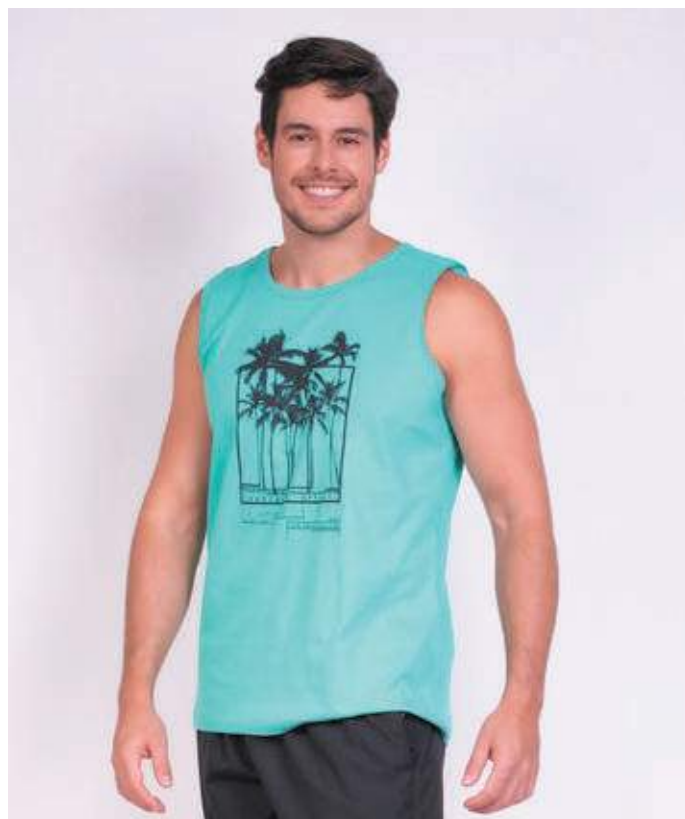
REF. 4459 CAMISETA REGATA TRADICIONAL MEIA MALHA 100% ALGODÃO TAM. P AO S8