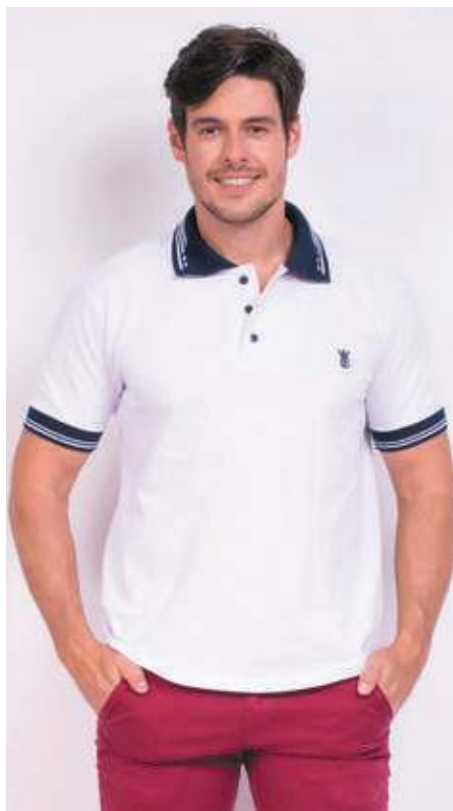
REF. 3100 CAMISETA POLO STREET PIQUET 98%ALGODÃO 02%ELASTANO TAM.: P AO GG