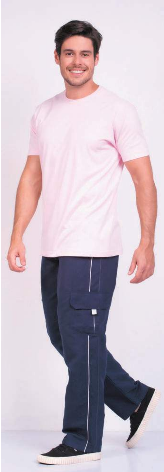
REF. 1220 CAMISETA TRADICIONAL MEIA MALHA 100% ALGODÃO TAM. 04 AO S10