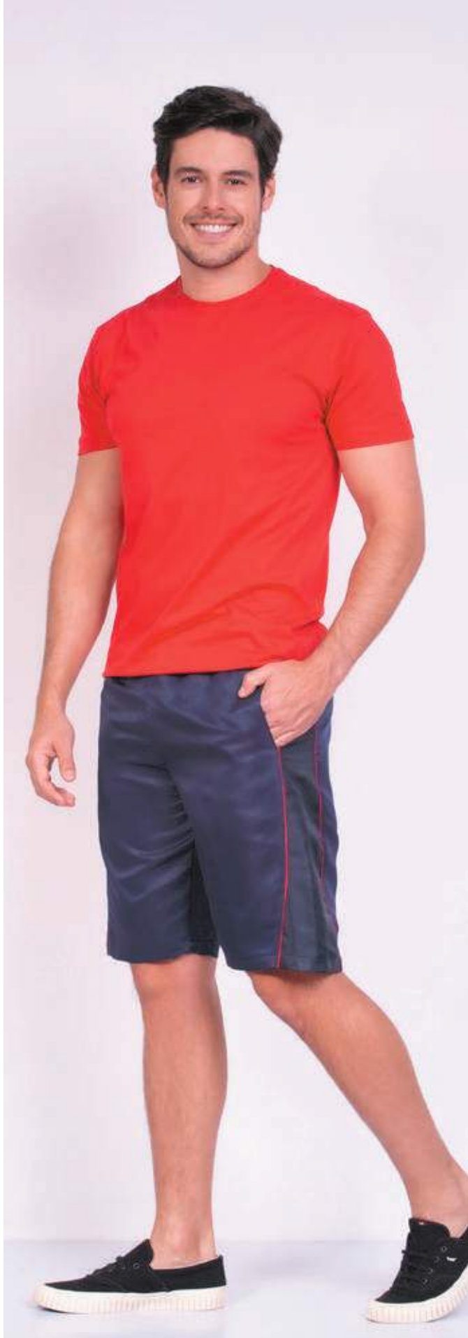
REF. 1220 CAMISETA TRADICIONAL MEIA MALHA 100% ALGODÃO TAM. 04 AO S10