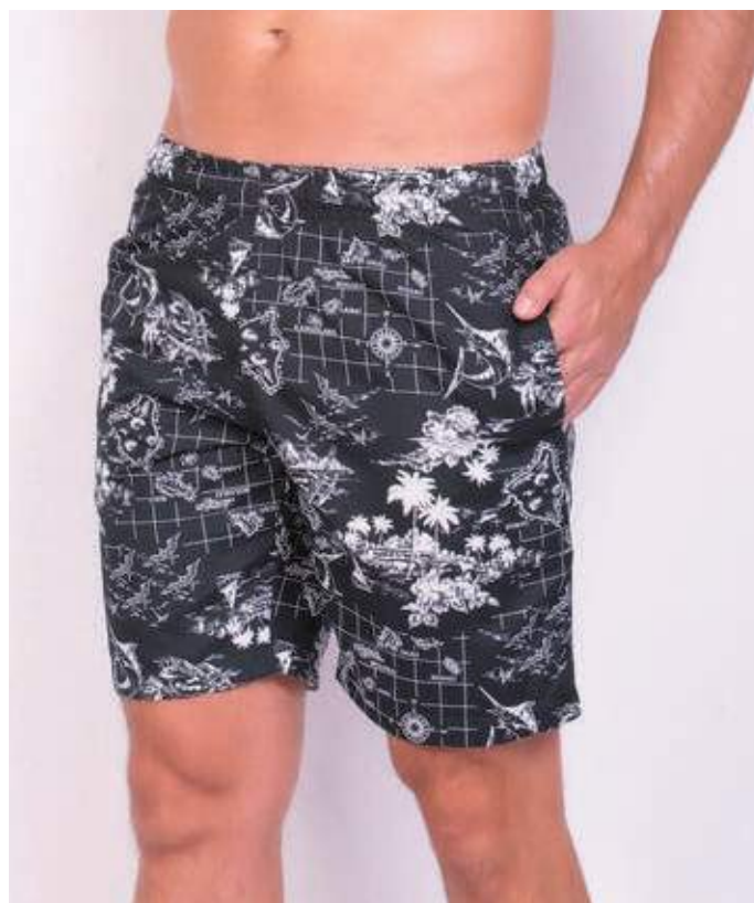
REF. 464 SHORTS DE ELÁSTICO MICRO FIBRA ESTAMPADA 100% POLIÉSTER TAM. P AO S5