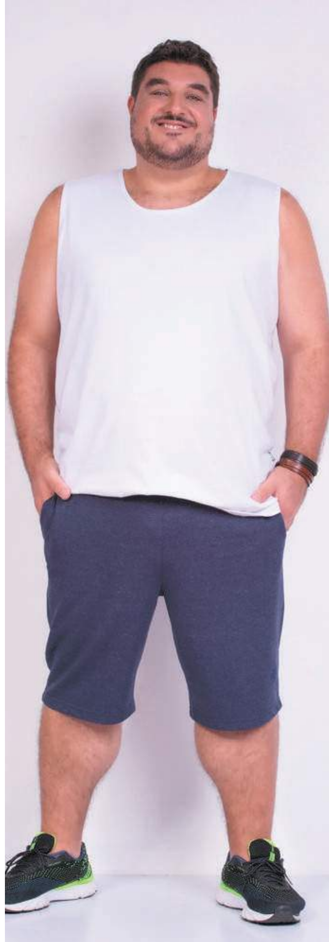
REF. 4422 CAMISETA REGATA TRADICIONAL MEIA MALHA 100% ALGODÃO TAM. P AO S8