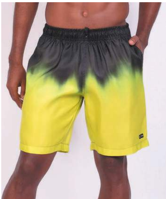
REF. 512 BERMUDA MAIS CURTA DE ELÁSTICO HIDRONAUTIC 91% POLIÉSTER 09% ELASTANO TAM. P AO S3