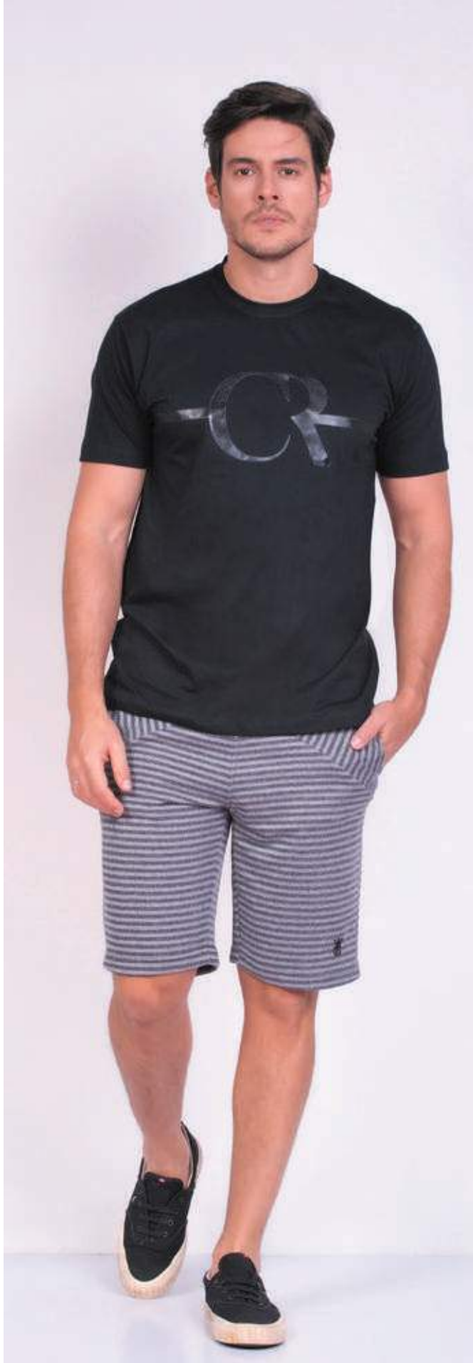
REF. 1804 CAMISETA TRADICIONAL MEIA MALHA 100% ALGODÃO TAM. P AO S5