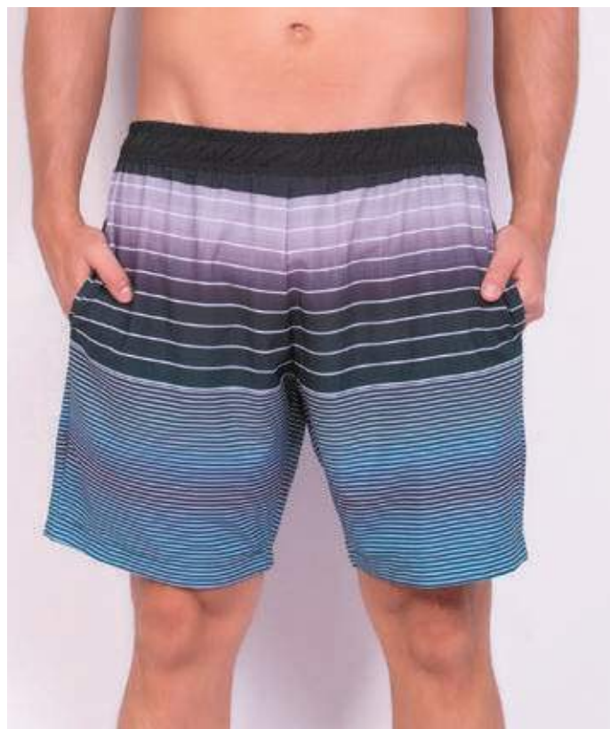
REF. 480 BERMUDA MAIS CURTA DE ELÁSTICO HIDRONAUTIC 91% POLIÉSTER 09% ELASTANO TAM. P AO S3