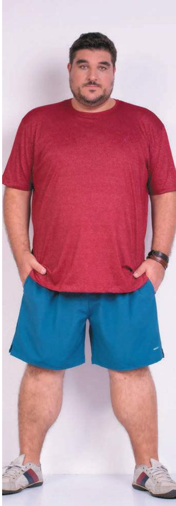
REF. 1225 CAMISETA TRADICIONAL SENSATION 62% ALGODÃO 38% POLIÉSTER TAM. 02 AO S8