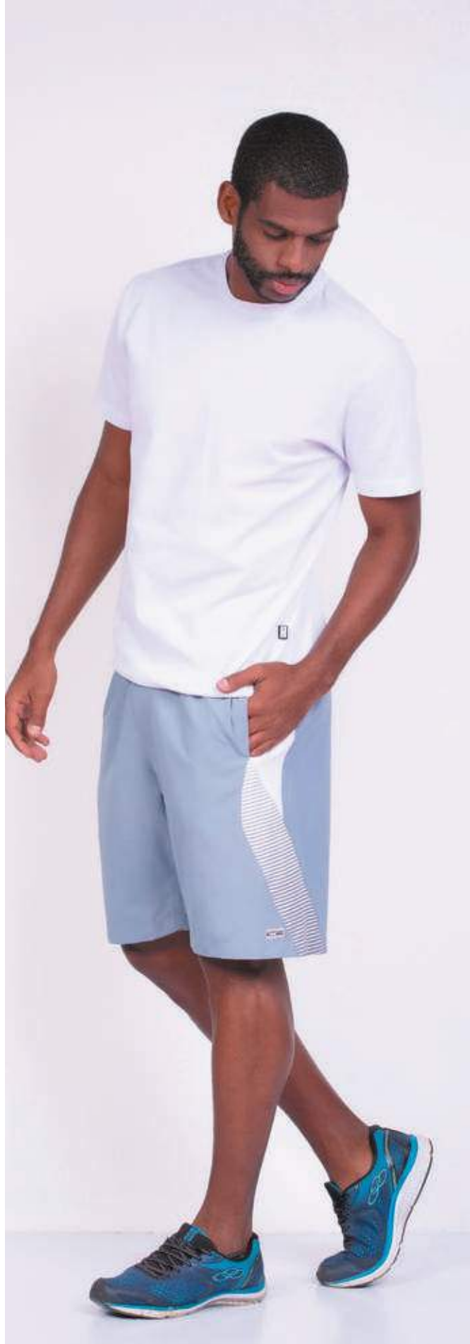
REF. 1220 CAMISETA TRADICIONAL MEIA MALHA 100% ALGODÃO TAM. 04 AO S10