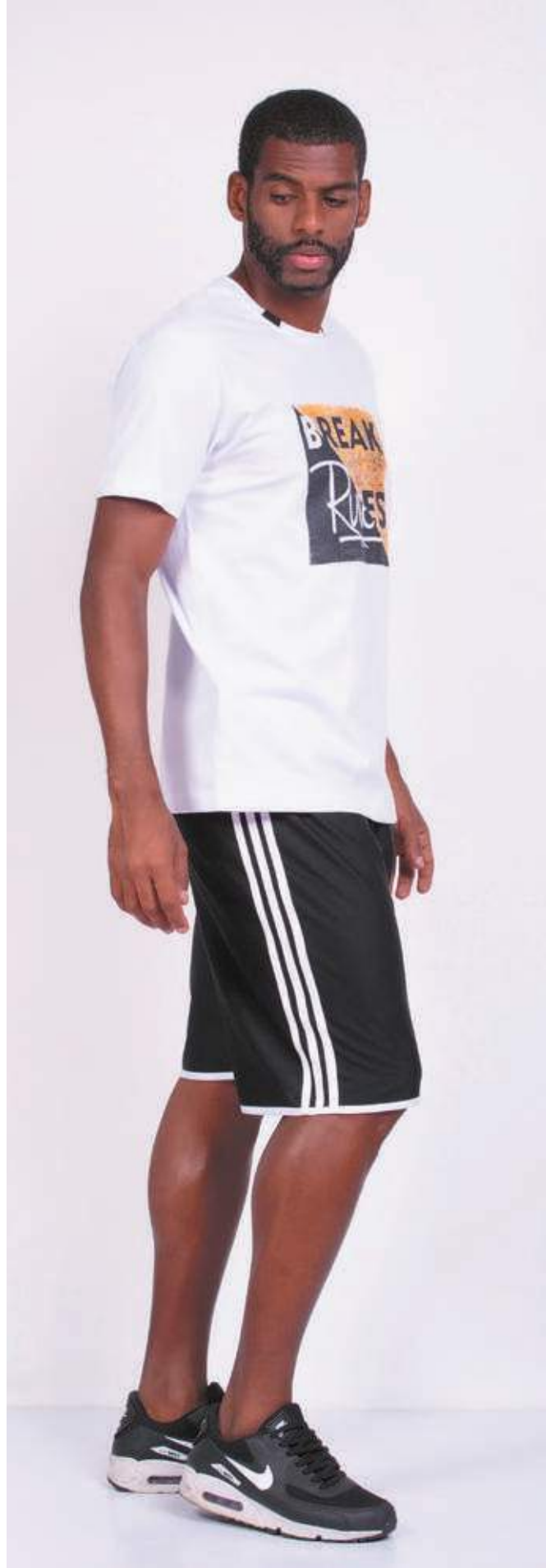
REF. 1555 CAMISETA STREET MEIA MALHA 100% ALGODÃO TAM. P AO S3