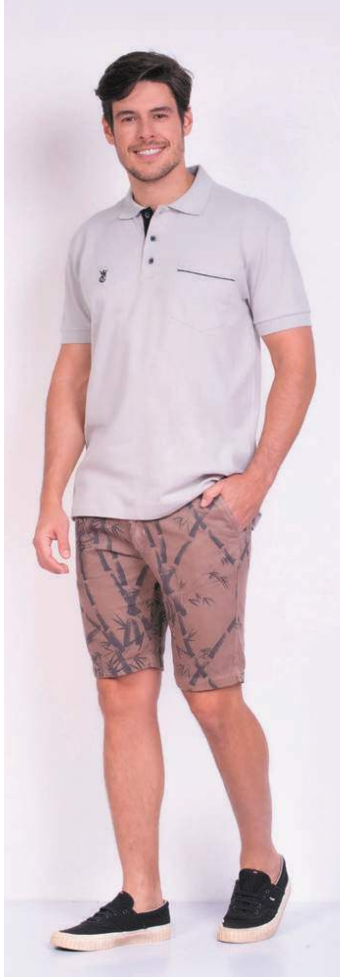
REF. 3376 CAMISETA POLO TRADICIONAL C/ BOLSO PIQUET SLIM 98% ALGODÃO 02% ELASTANO TAM. P AO S5