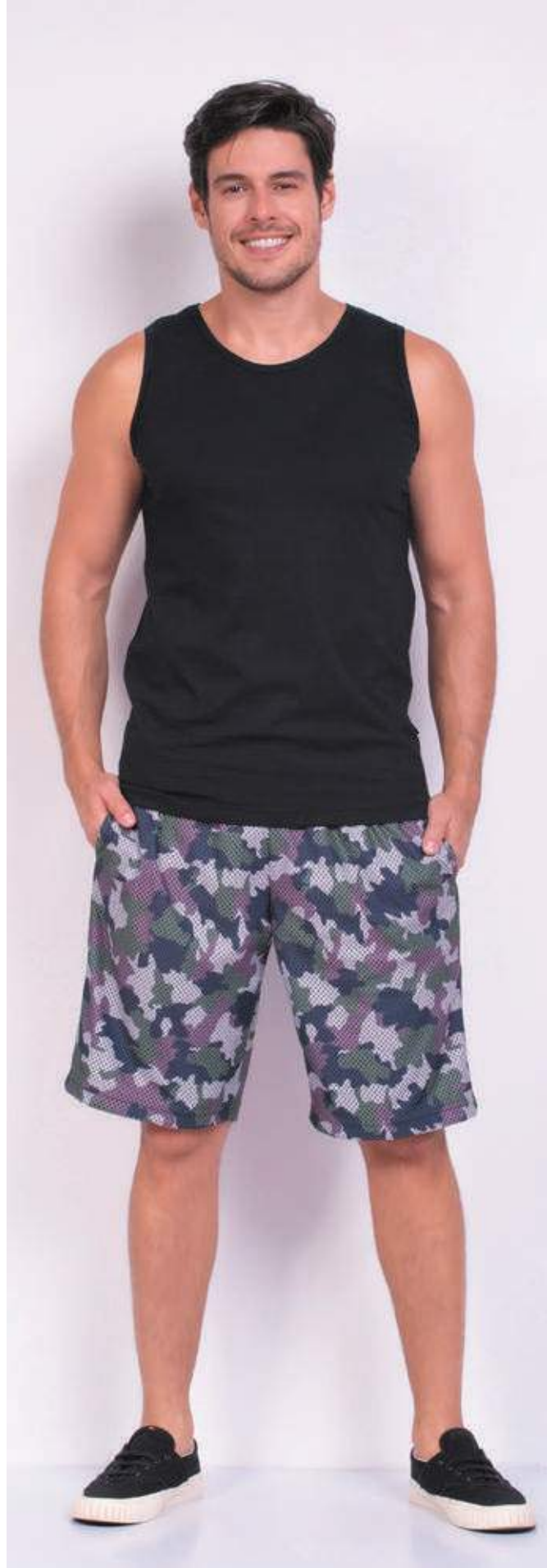
REF. 4422 CAMISETA REGATA TRADICIONAL MEIA MALHA 100% ALGODÃO TAM. P AO S8