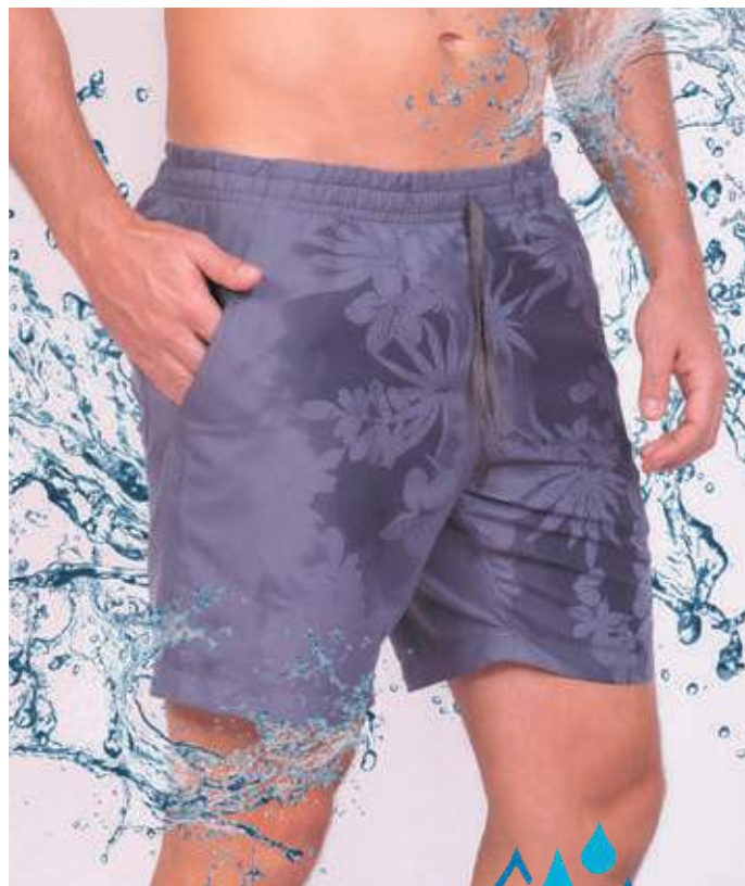
REF. 611 SHORTS DE ELÁSTICO MAGIC COLOR 100% POLIÉSTER TAM. 04 AO S5