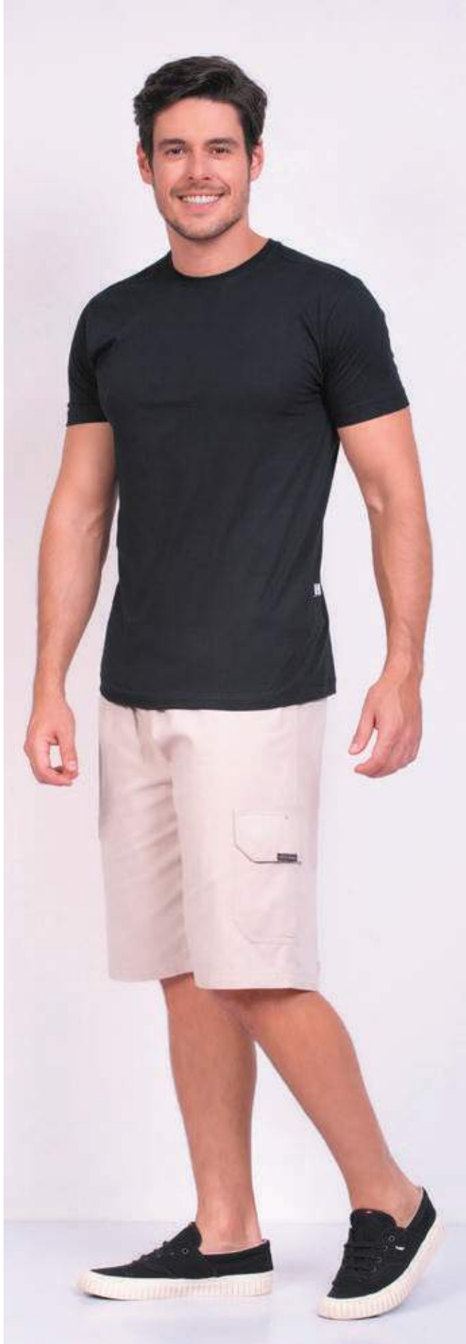
REF. 1220 CAMISETA TRADICIONAL MEIA MALHA 100% ALGODÃO TAM. 04 AO S10