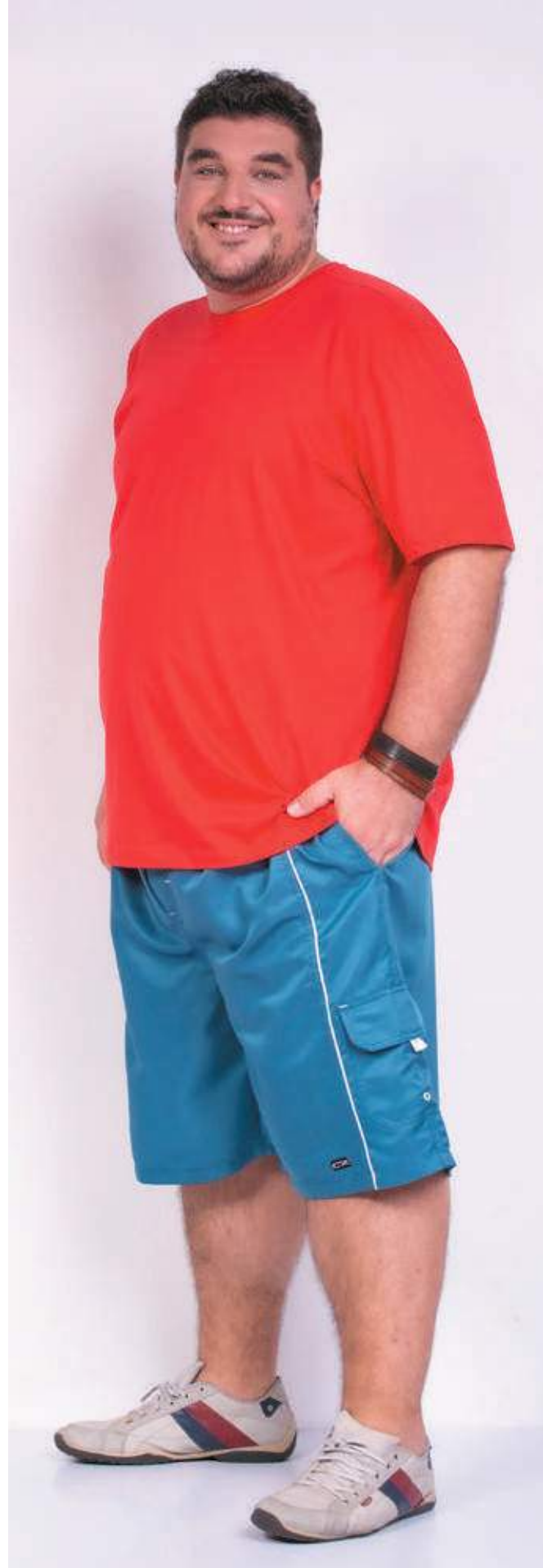
REF. 1220 CAMISETA TRADICIONAL MEIA MALHA 100% ALGODÃO TAM. 04 AO S10