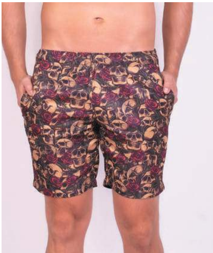
REF. 462 SHORTS DE ELÁSTICO MICRO SARJA 100% POLIÉSTER TAM. P AO S8