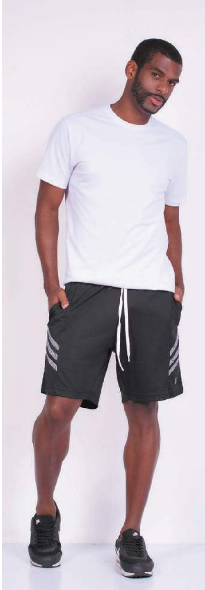
REF. 1220 CAMISETA TRADICIONAL MEIA MALHA 100% ALGODÃO TAM. 04 AO S10