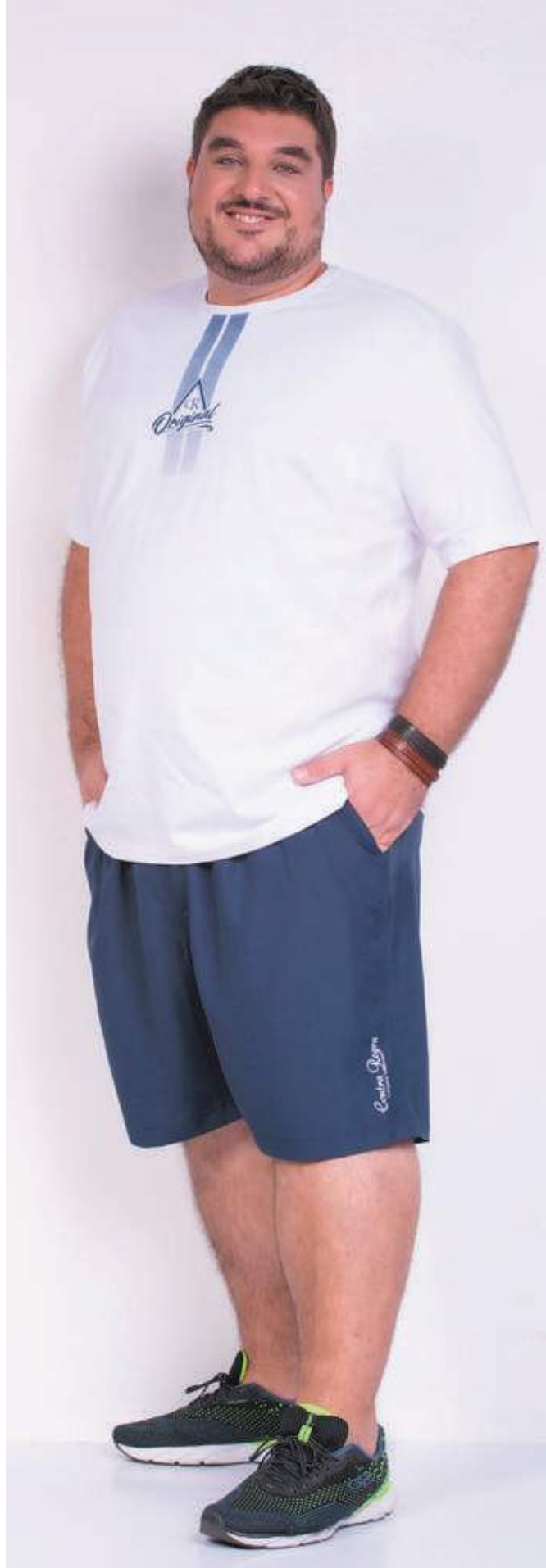
REF. 1556 CAMISETA TRADICIONAL MEIA MALHA 100% ALGODÃO TAM. P AO S5