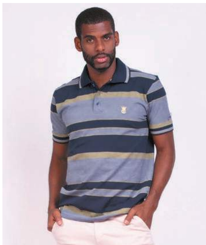
REF. 3090 CAMISETA POLO STREET MALHA 74% ALGODÃO 23% POLIÉSTER 03% ELASTANO TAM. P AO GG