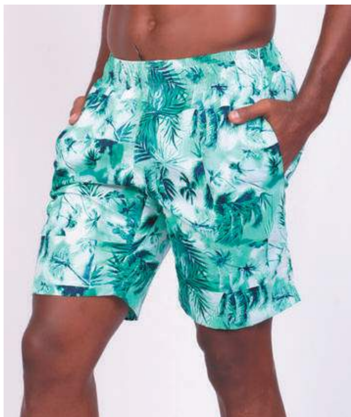
REF. 263 SHORT DE ELÁSTICO MICRO FIBRA ESTAMPADA 100% POLIÉSTER TAM. P AO GG