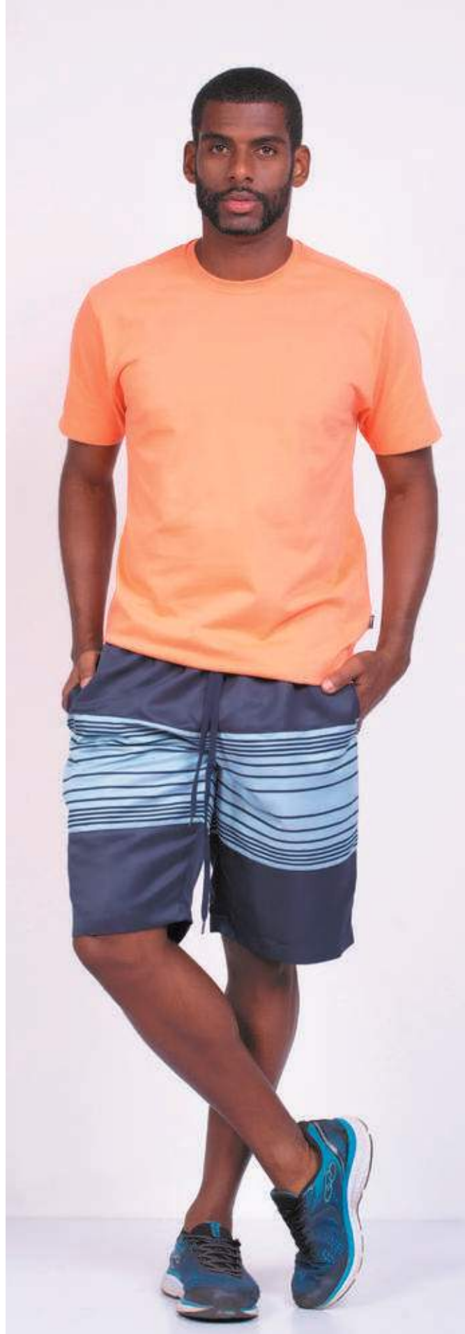
REF. 1220 CAMISETA TRADICIONAL MEIA MALHA 100% ALGODÃO TAM. 04 AO S10