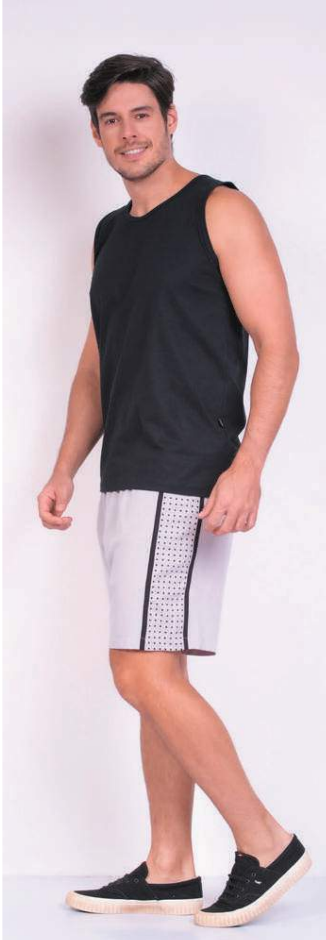
REF. 4422 CAMISETA REGATA TRADICIONAL MEIA MALHA 100% ALGODÃO TAM. P AO S8