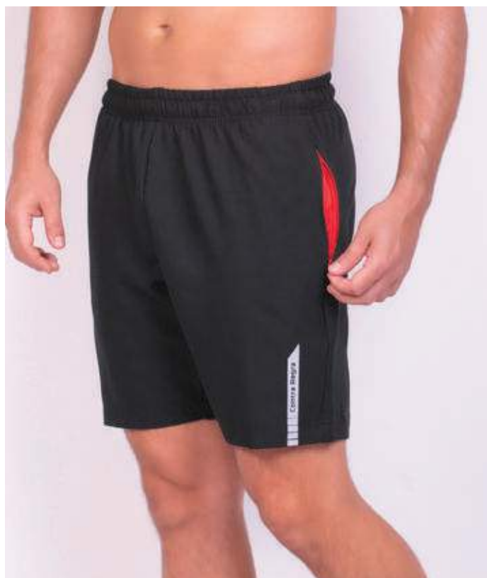
REF. 591 BERMUDA MAIS CURTA DE ELÁSTICO DIAMOND FLEX 92% POLIÉSTER 08% ELASTANO TAM. P AO S5