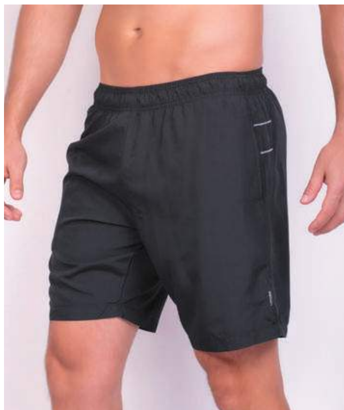
REF. 414 BERMUDA MAIS CURTA DE ELÁSTICO EXCIM 100% POLIÉSTER TAM. P AO S8