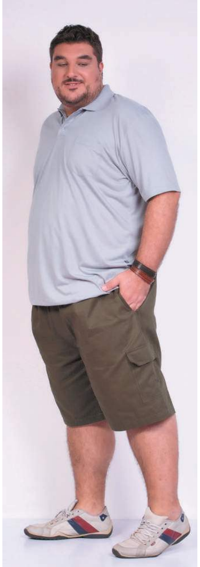
REF. 3449 CAMISETA POLO TRADICIONAL C/ BOLSO MALHA PV 65% ALGODÃO 35% VISCOSE TAM. P AO S5