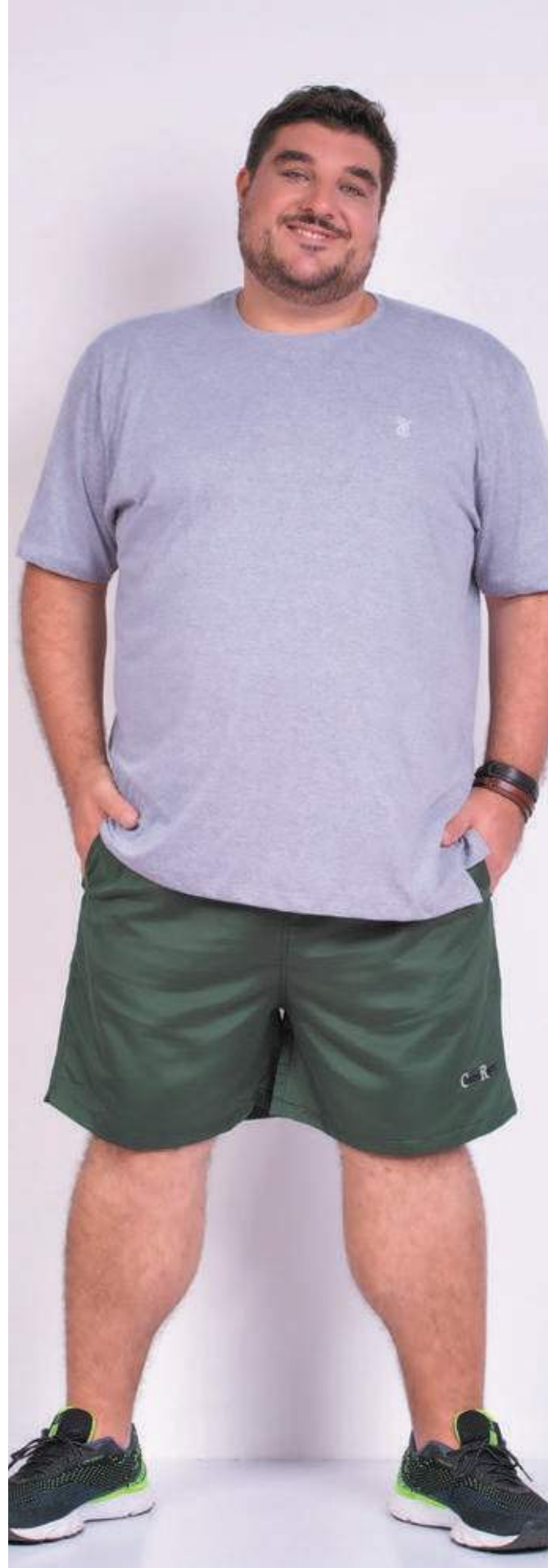
REF. 1225 CAMISETA TRADICIONAL SENSATION 62% ALGODÃO 38% POLIÉSTER TAM. 02 AO S8