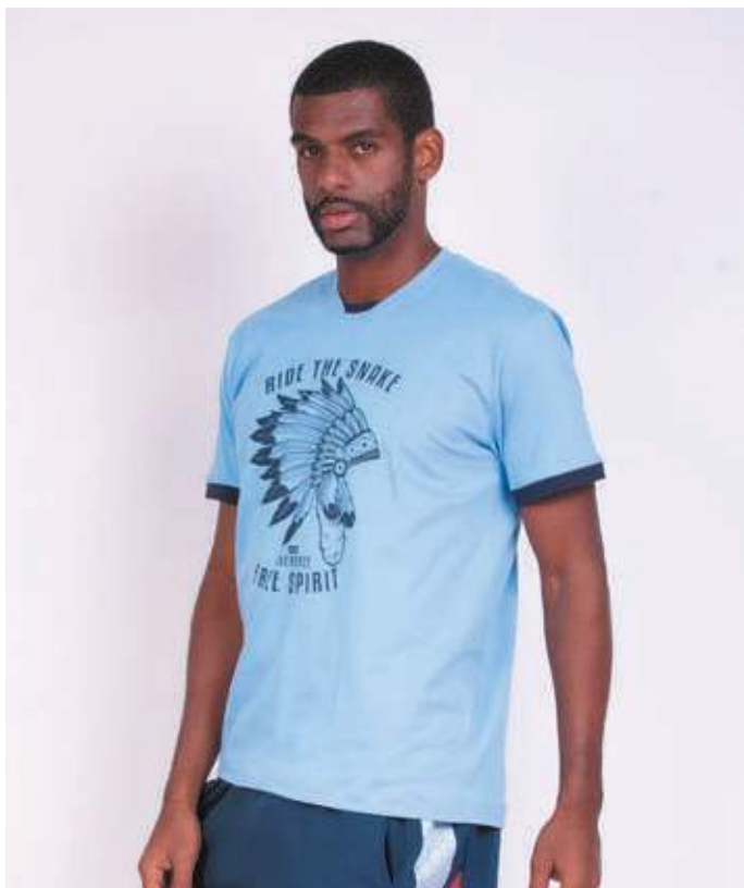
REF. 1803 CAMISETA STREET MEIA MALHA 100% ALGODÃO TAM. P AO GG