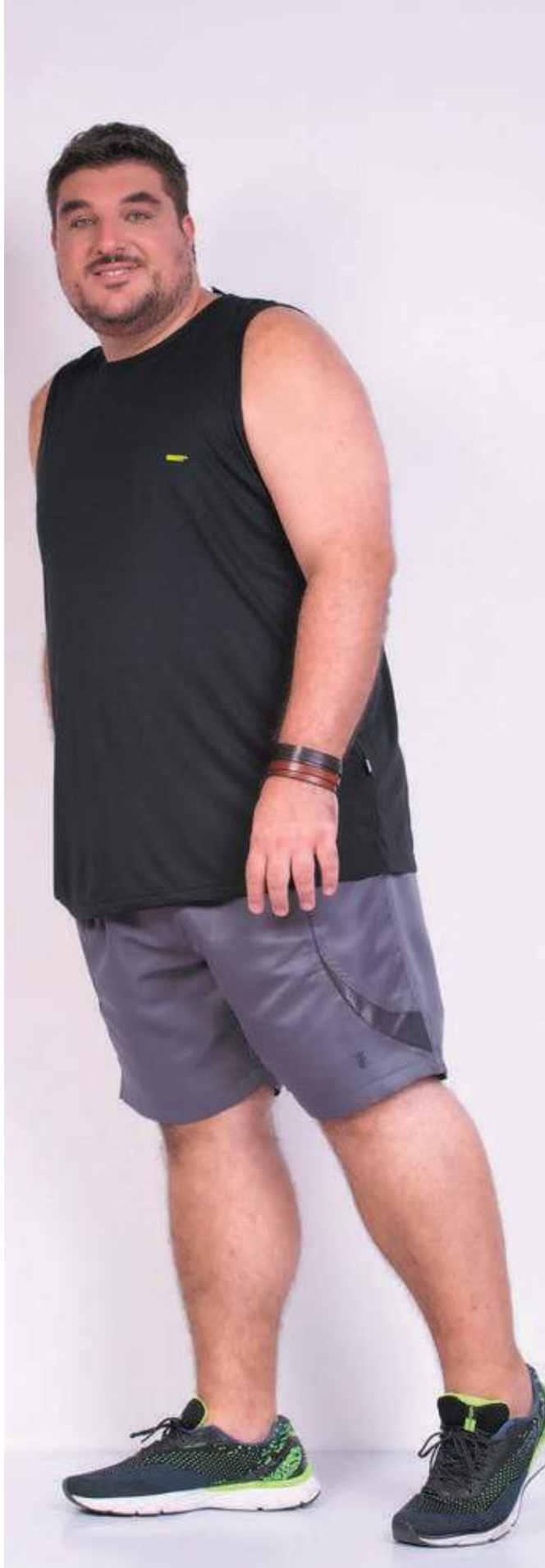
REF. 4450 CAMISETA REGATA TRADICIONAL HELANCA 100% POLIÉSTER TAM. P AO S5