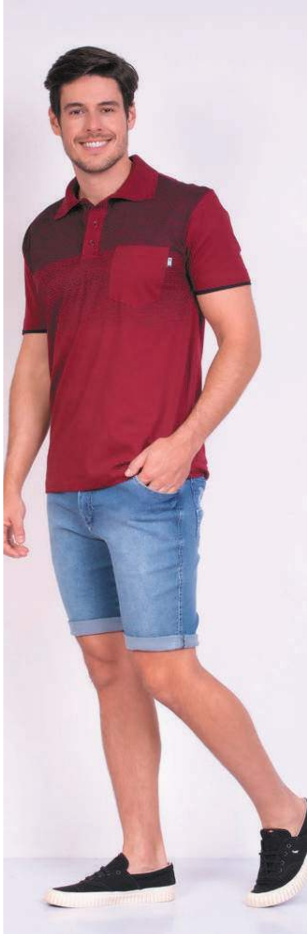
REF. 3381 CAMISETA POLO TRADICIONAL MEIA MALHA 100% ALGODÃO TAM. P AO S5