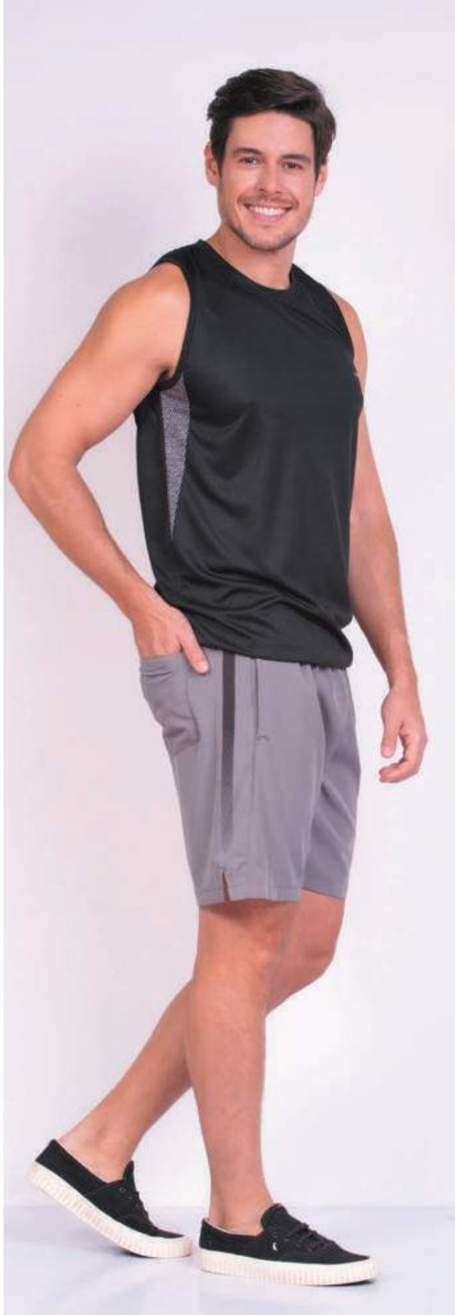
REF. 4456 CAMISETA REGATA TRADICIONAL DRY FRESH 100% POLIÉSTER TAM. P AO S5