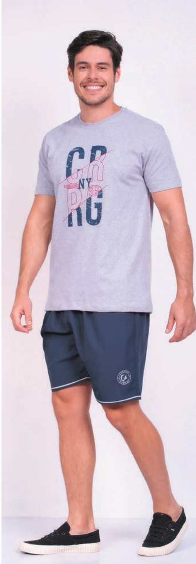
REF. 1808 CAMISETA TRADICIONAL MEIA MALHA 100% ALGODÃO TAM. P AO S8