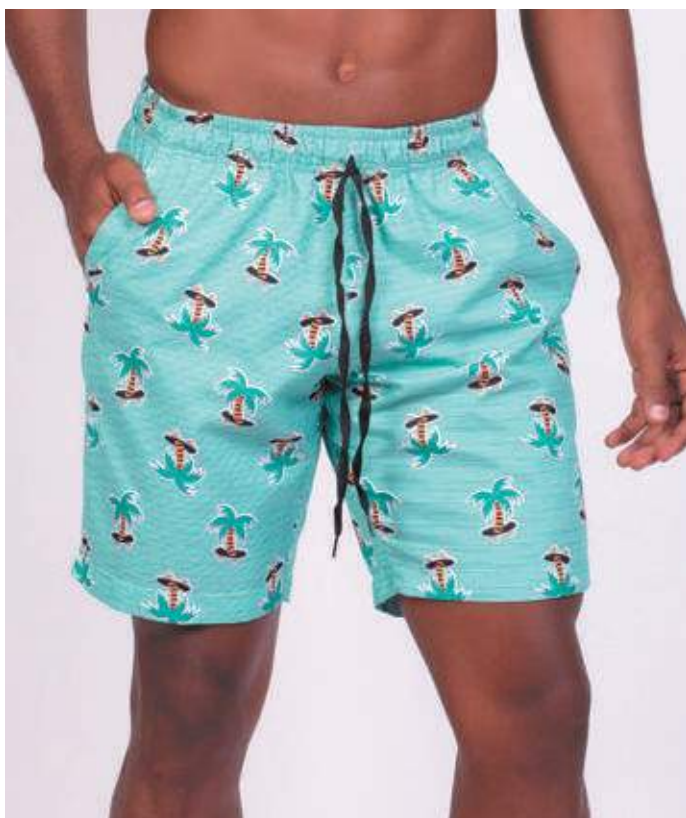
REF. 465 SHORTS DE ELÁSTICO MICRO FIBRA ESTAMPADA 100% POLIÉSTER TAM. 06 AO S5