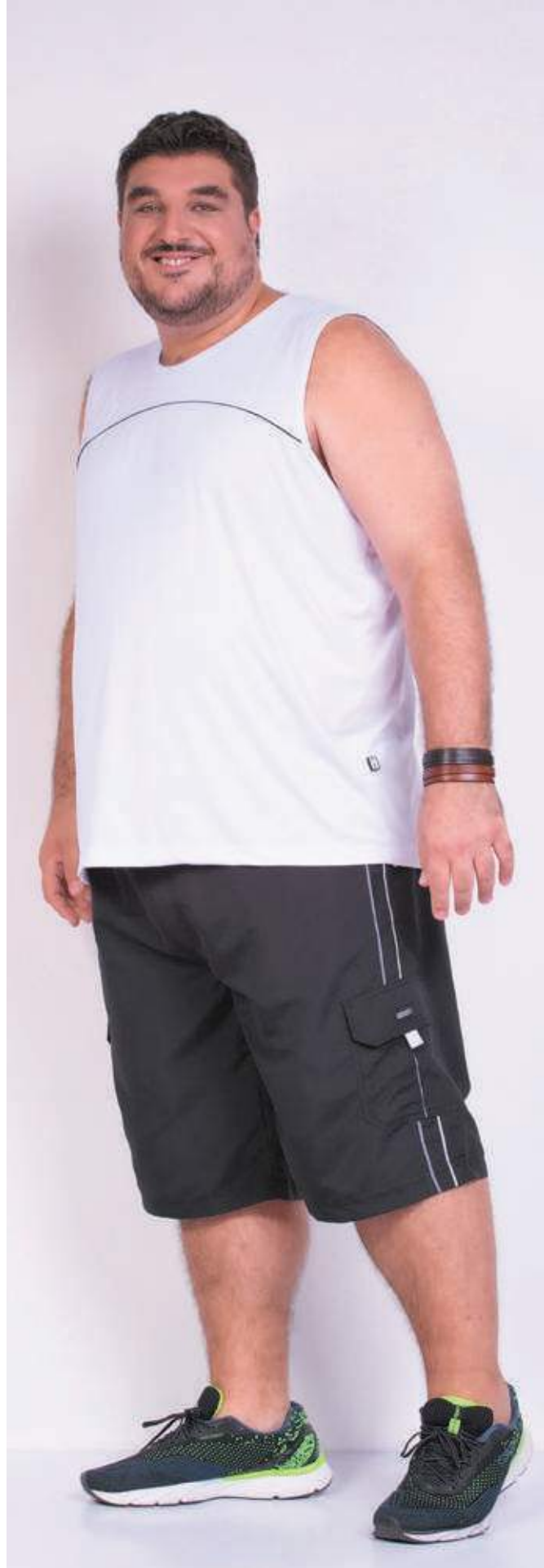
REF. 4451 CAMISETA REGATA TRADICIONAL HELANCA 100% POLIÉSTER TAM. P AO S5