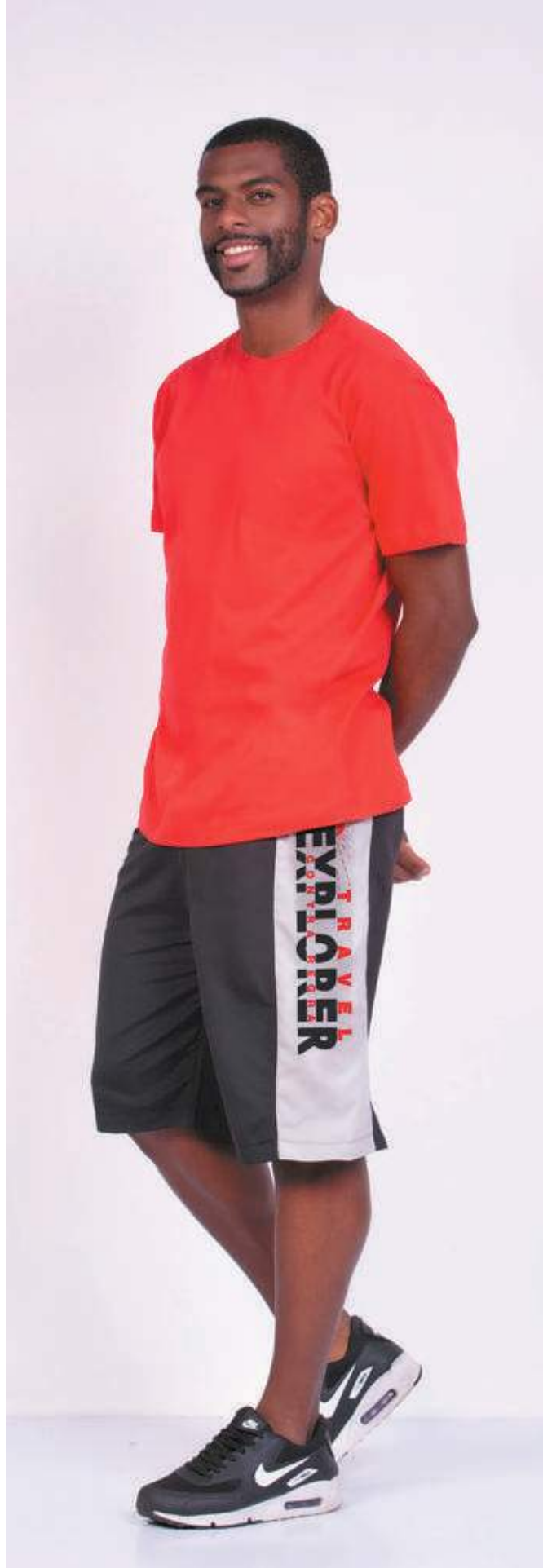
REF. 1220 CAMISETA TRADICIONAL MEIA MALHA 100% ALGODÃO TAM. 04 AO S10