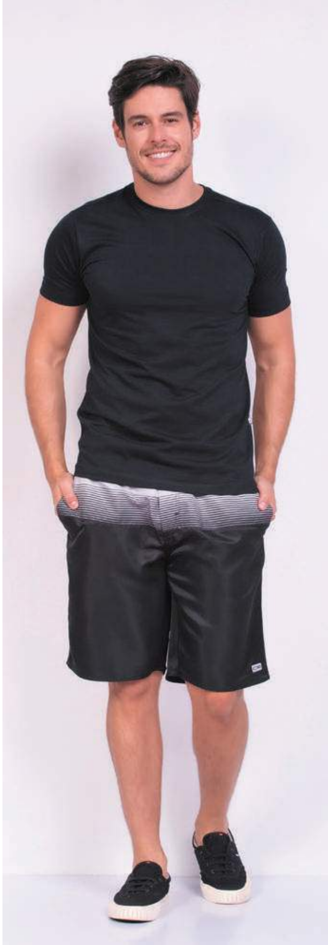
REF. 1220 CAMISETA TRADICIONAL MEIA MALHA 100% ALGODÃO TAM. 04 AO S10