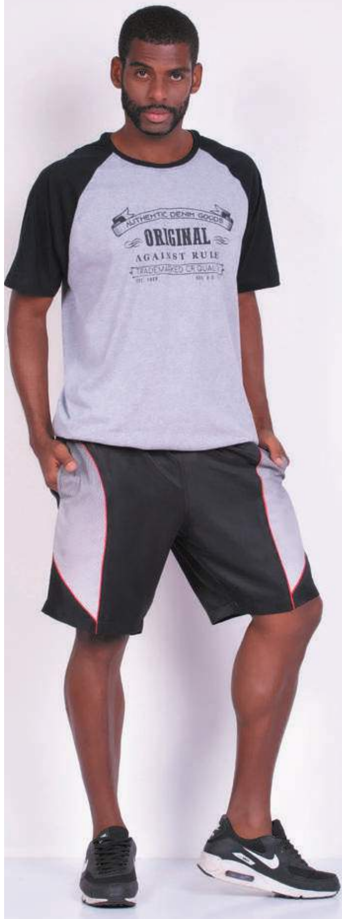
REF. 1563 CAMISETA TRADICIONAL MEIA MALHA 100% ALGODÃO TAM. P AO S8