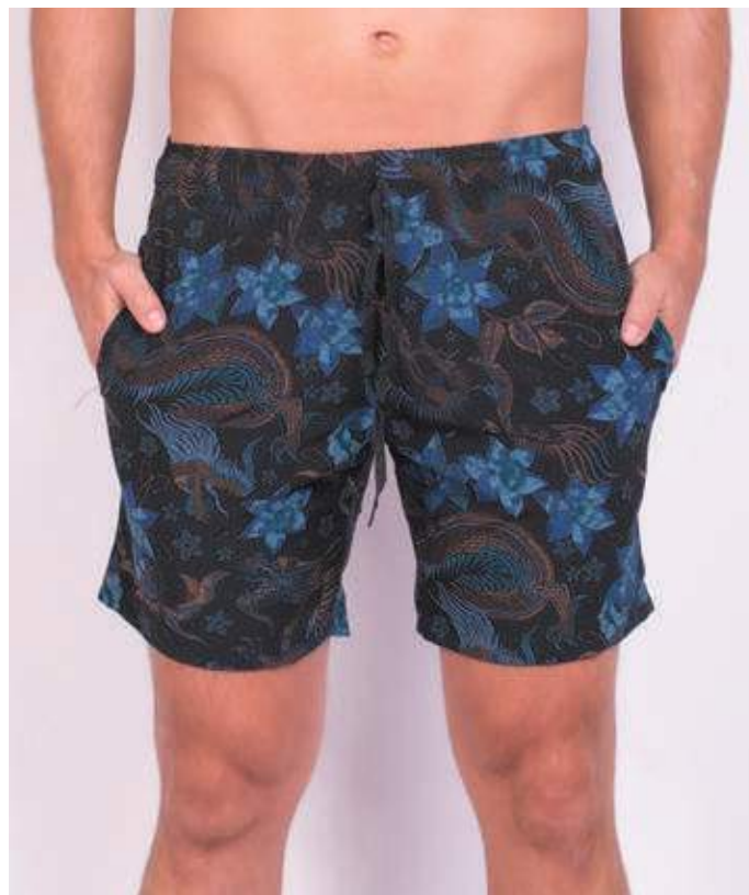
REF. 325 SHORTS DE ELÁSTICO HIDRONAUTIC 91% POLIÉSTER 09% ELASTANO TAM. P AO S5