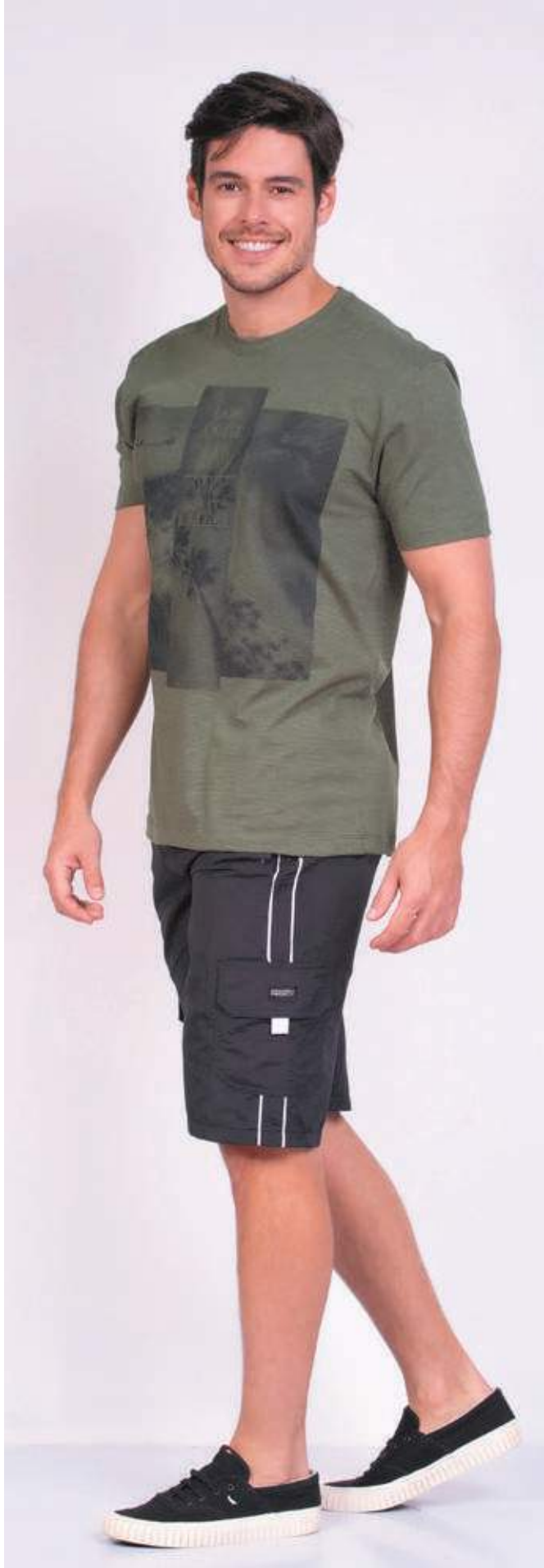
REF.1812 CAMISETA TRADICIONAL MACMAR 75% ALGODÃO 25% POLIÉSTER TAM.: P AO S5