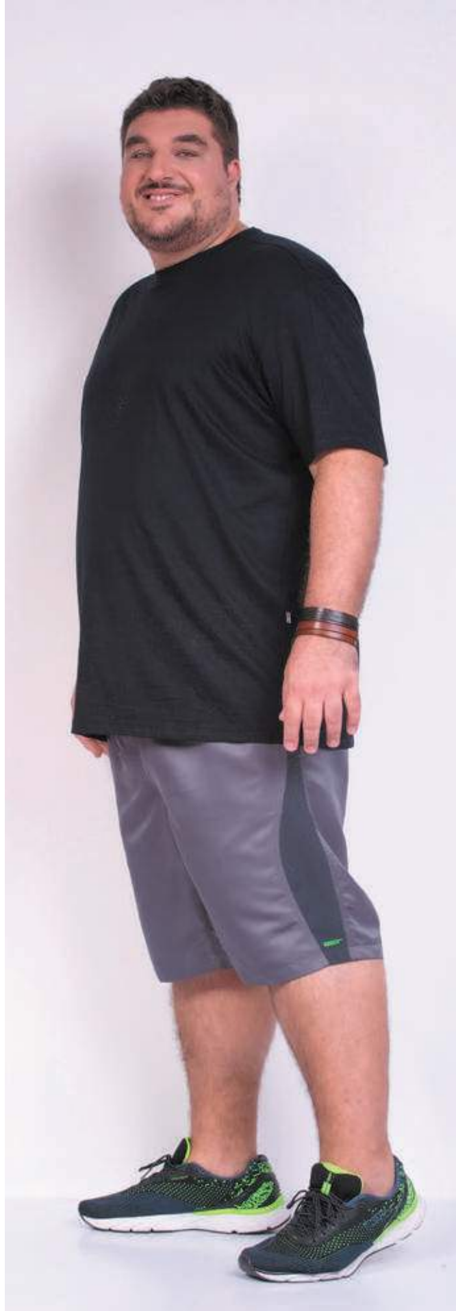
REF. 1220 CAMISETA TRADICIONAL MEIA MALHA 100% ALGODÃO TAM. 04 AO S10