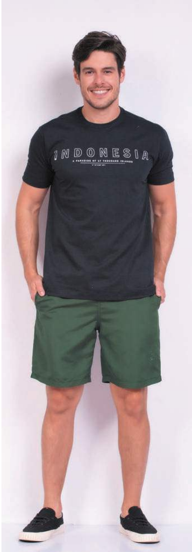
REF. 1568 CAMISETA TRADICIONAL. MEIA MLHA 100% ALGODÃO TAM. P AO S8