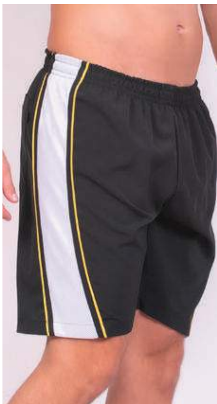
REF. 520 BERMUDA MAIS CURTA DE ELÁSTICO MICRO FIBRA C/ ELASTANO 91% POLIÉSTER 09% ELASTANO TAM. P AO S8