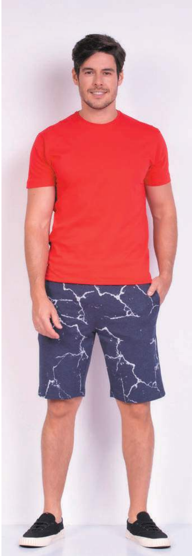
REF. 1220 CAMISETA TRADICIONAL MEIA MALHA 100% ALGODÃO TAM. 04 AO S10