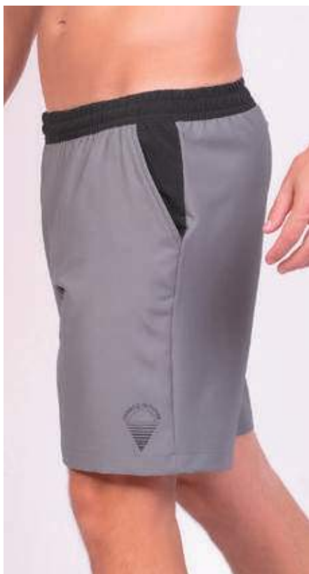
REF. 507 BERMUDA MAIS CURTA DE ELÁSTICO DIAMOND FLEX 92% POLIÉSTER 08% ELASTANO TAM. 10 AO S5