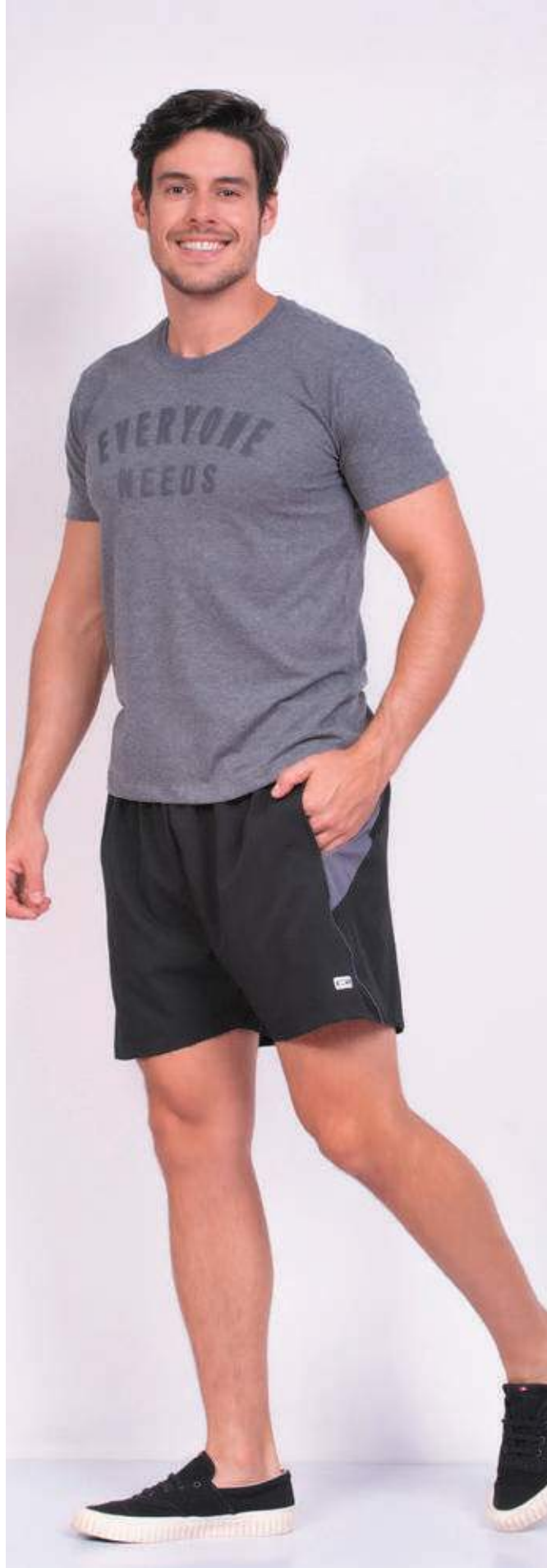
REF. 1574 CAMISETA STREET MEIA MALHA 100% ALGODÃO TAM. P AO GG