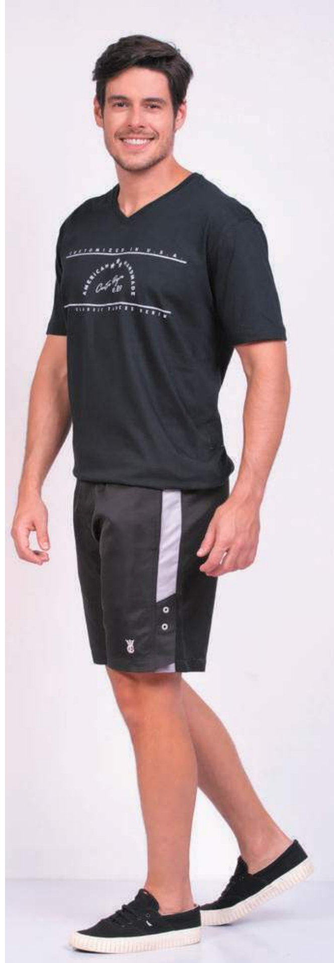
REF. 1564 CAMISETA GOLA V TRADICIONAL MEIA MALHA 100% ALGODÃO TAM. P AO S10