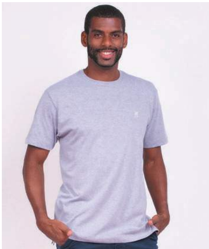
REF. 1225 CAMISETA TRADICIONAL MEIA MALHA 68% ALGODÃO 32% POLIÉSTER TAM. 02 AO S8