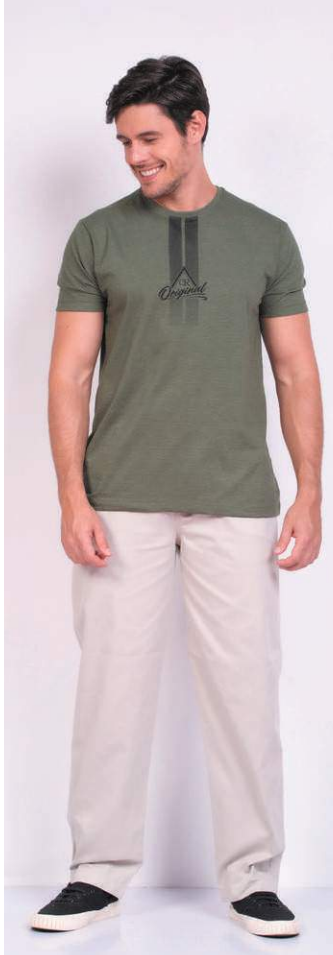
REF. 1556 CAMISETA TRADICIONAL MEIA MALHA 100% ALGODÃO TAM. P AO S5