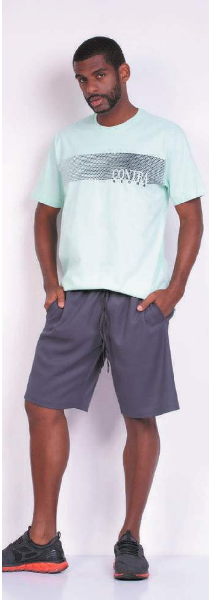
REF. 1807 CAMISETA TRADICIONAL MEIA MALHA 100% ALGODÃO TAM. P AO S8