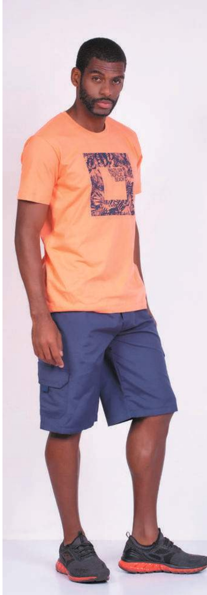
REF. 1802 CAMISETA STREET MEIA MALHA 100% ALGODÃO TAM. P AO GG