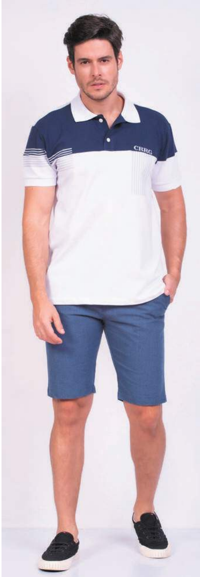
REF. 3399 CAMISETA POLO TRADICIONAL PIQUET 92% POLIÉSTER 08% ELASTANO TAM. P AO S5