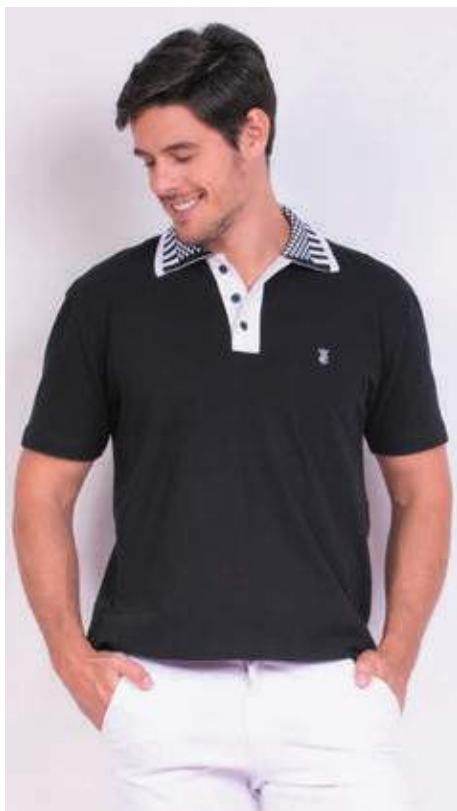
REF. 3377 CAMISETA POLO TRADICIONAL PIQUET 98%ALGODÃO 02%ELASTANO TAM.: P AO S5