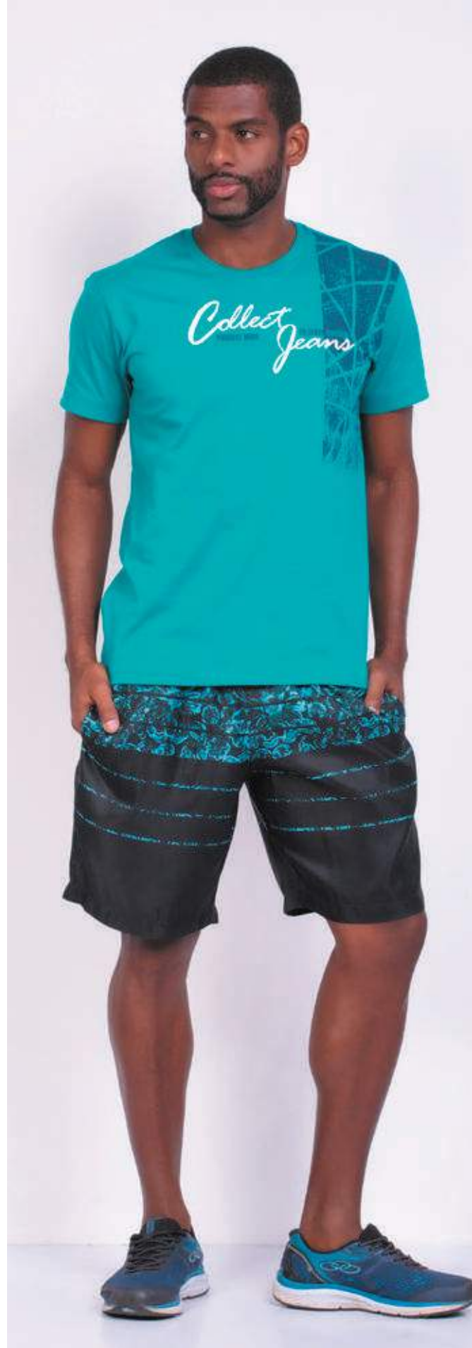
REF. 1576 CAMISETA STREET MEIA MALHA 100% ALGODÃO TAM. P AO GG