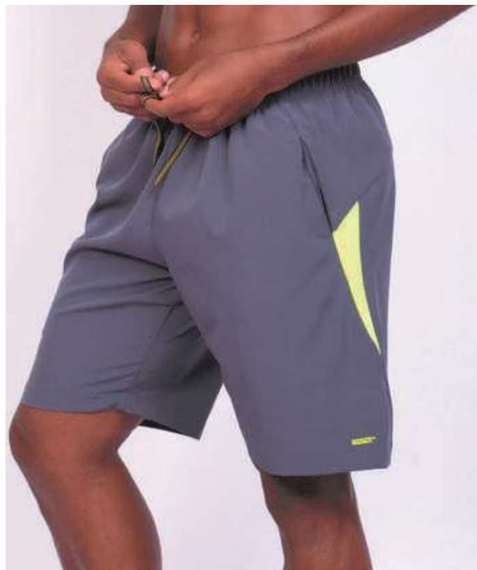
REF. 474 BERMUDA MAIS CURTA DE ELÁSTICO MICRO FIBRA COM ELASTANO 90% POLIÉSTER 10% ELASTANO TAM. P AO S8