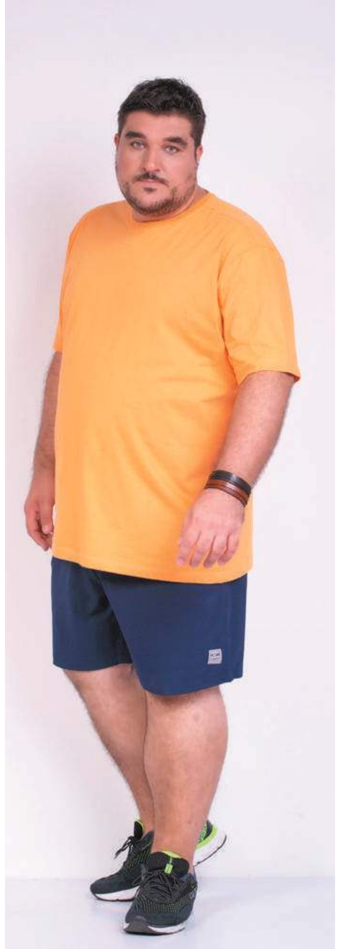
REF. 1220 CAMISETA TRADICIONAL MEIA MALHA 100% ALGODÃO TAM. 04 AO S10