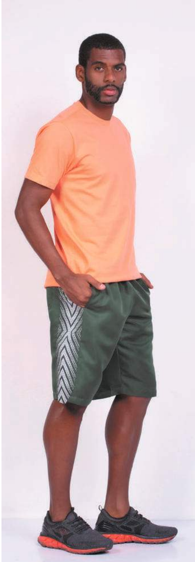
REF. 1220 CAMISETA TRADICIONAL MEIA MALHA 100% ALGODÃO TAM. 04 AO S10