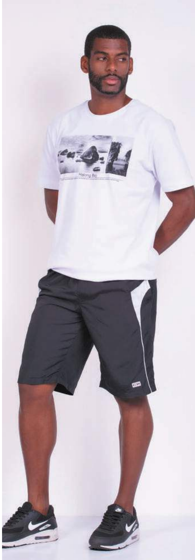
REF. 1567 CAMISETA TRADICIONAL MEIA MALHA 100% ALGODÃO TAM. P AO S8