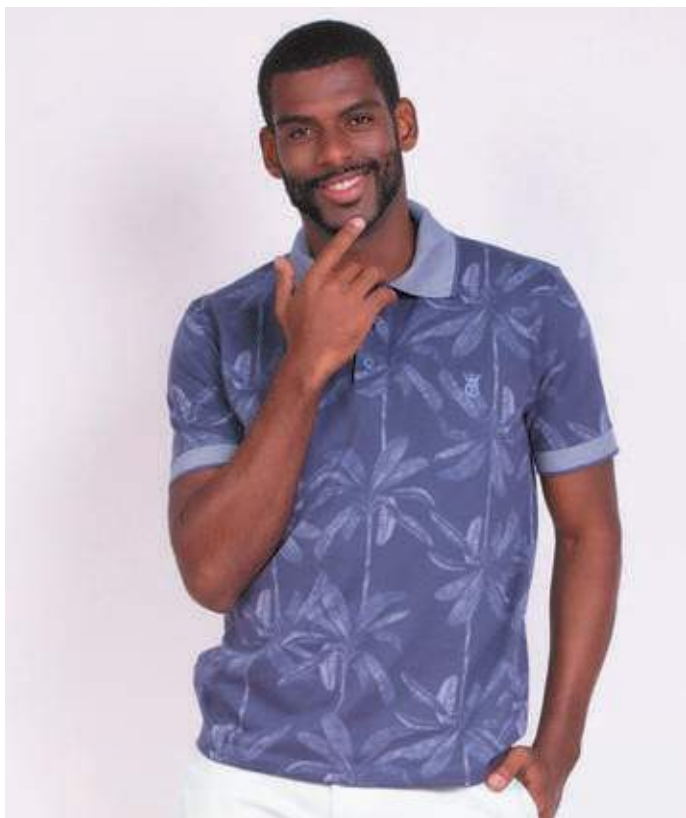
REF. 3356 CAMISETA POLO STREET MALHA JACQUARD 50% ALGODÃO 50% POLIÉSTER TAM. P AO GG