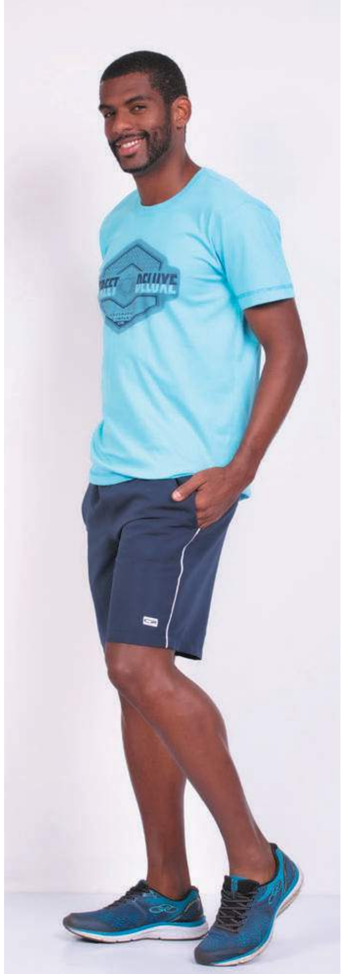
REF. 1800 CAMISETA STREET MEIA MALHA 100% ALGODÃO TAM. P AO GG