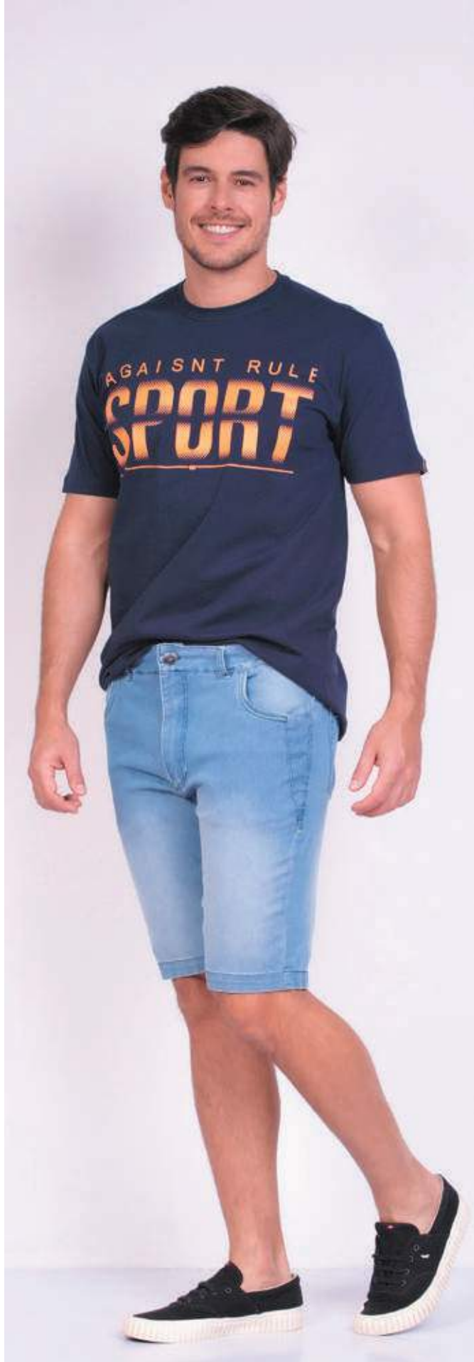
REF. 1570 CAMISETA TRADICIONAL MEIA MALHA 100% ALGODÃO TAM. P AO S5