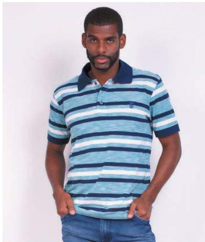
REF. 3320 CAMISETA POLO STREET PIQUET 85% ALGODÃO 15% POLIÉSTER TAM. P AO GG