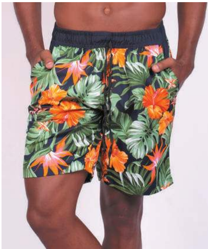
REF. 466 SHORTS DE ELÁSTICO MICRO FIBRA ESTAMPADA 100% POLIÉSTER TAM. P AO S5