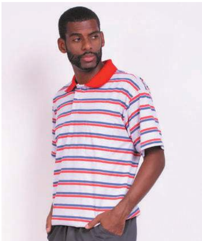
REF. 3848 CAMISETA POLO TRADICIONAL MEIA MALHA 75% ALGODÃO 25% POLIÉSTER TAM. P AO S5