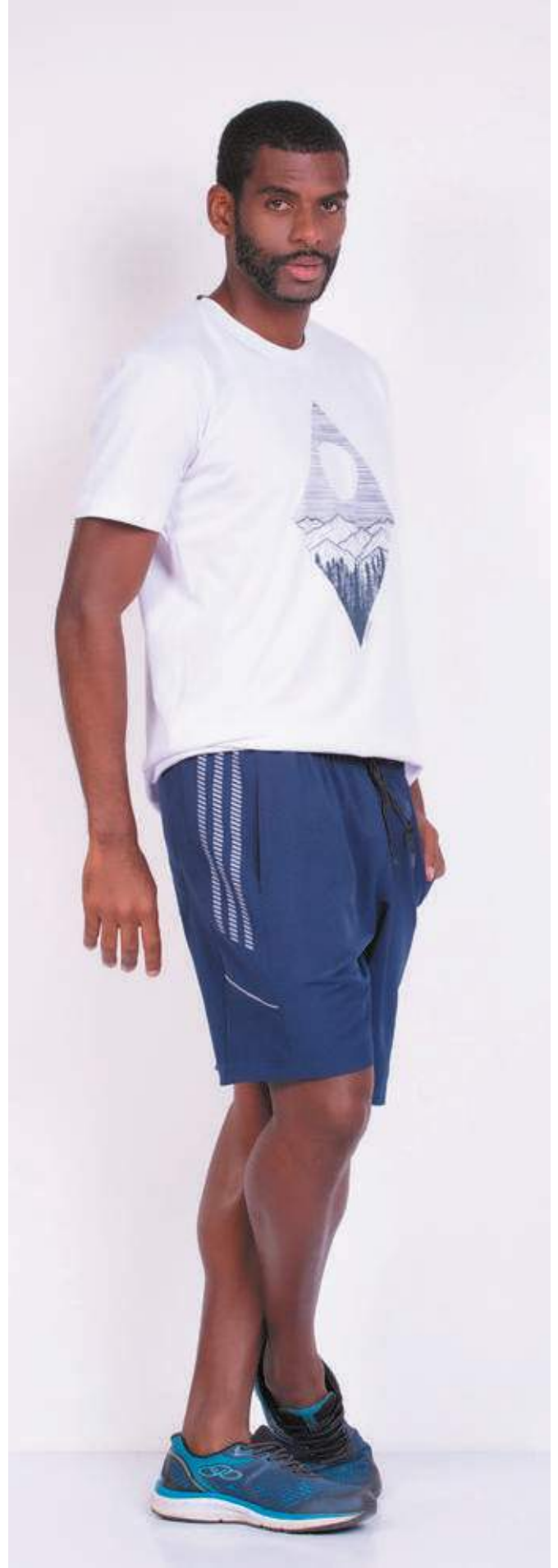
REF. 1573 CAMISETA STREET MEIA MALHA 100% ALGODÃO TAM. P AO GG