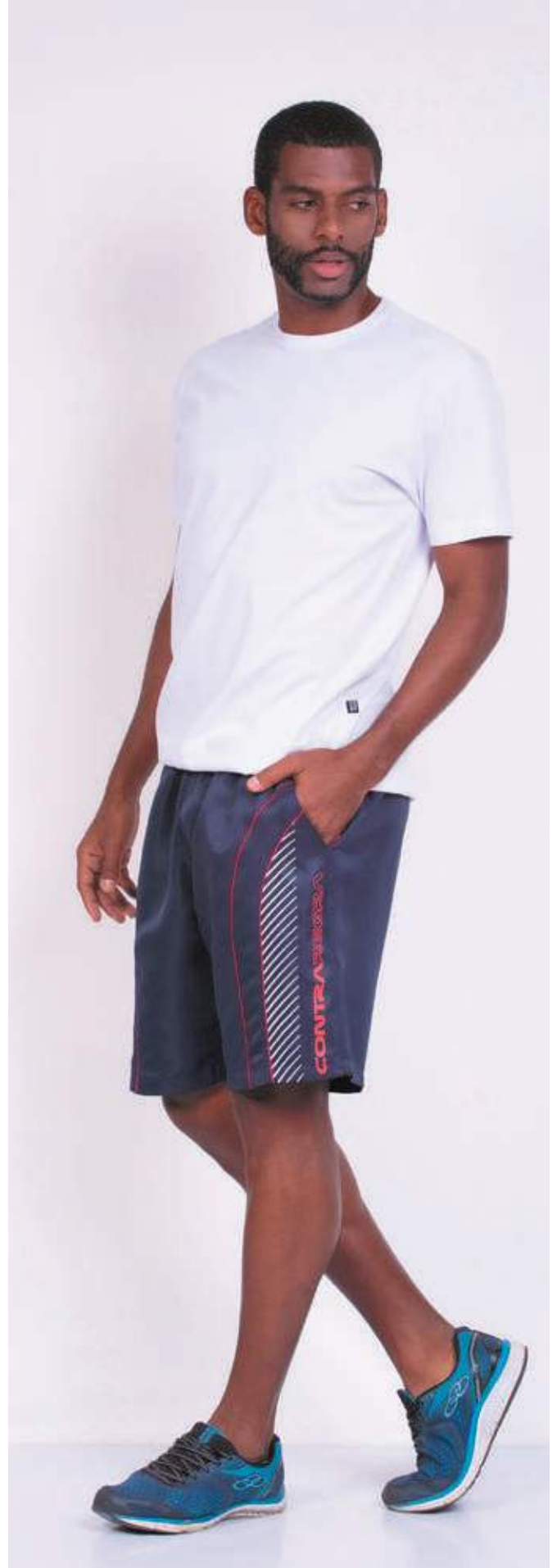
REF. 1220 CAMISETA TRADICIONAL MEIA MALHA 100% ALGODÃO TAM. 04 AO S10