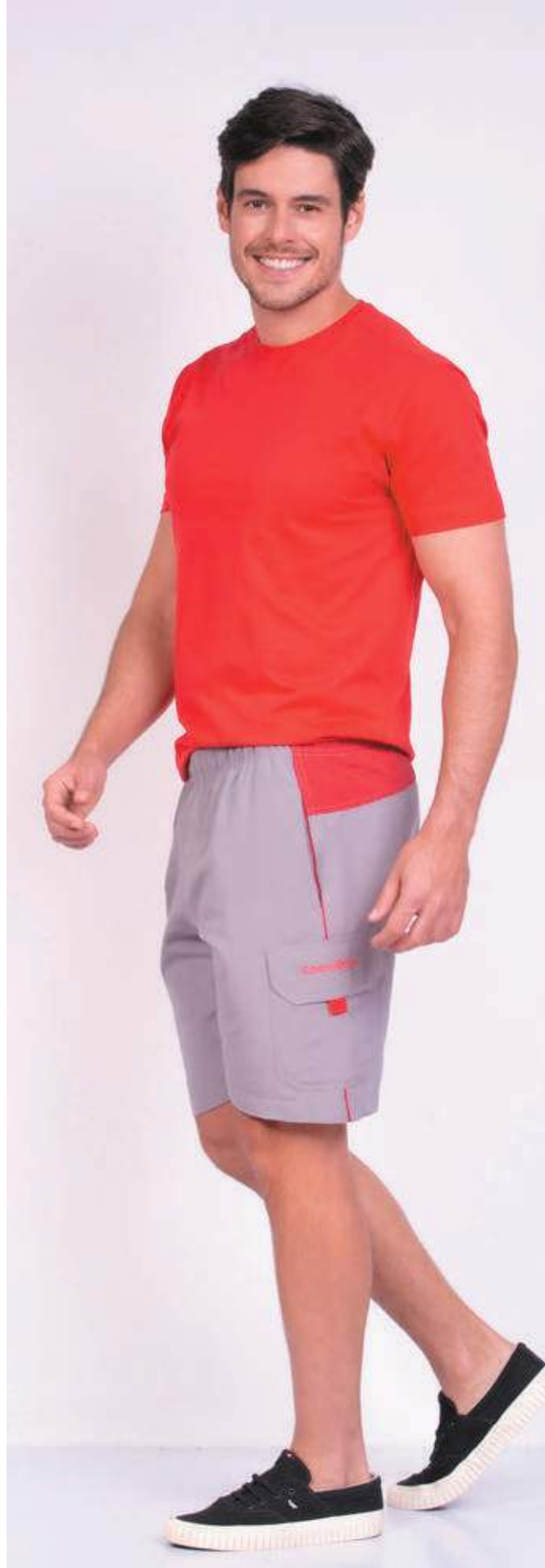
REF. 1220 CAMISETA TRADICIONAL MEIA MALHA 100% ALGODÃO TAM. 04 AO S10