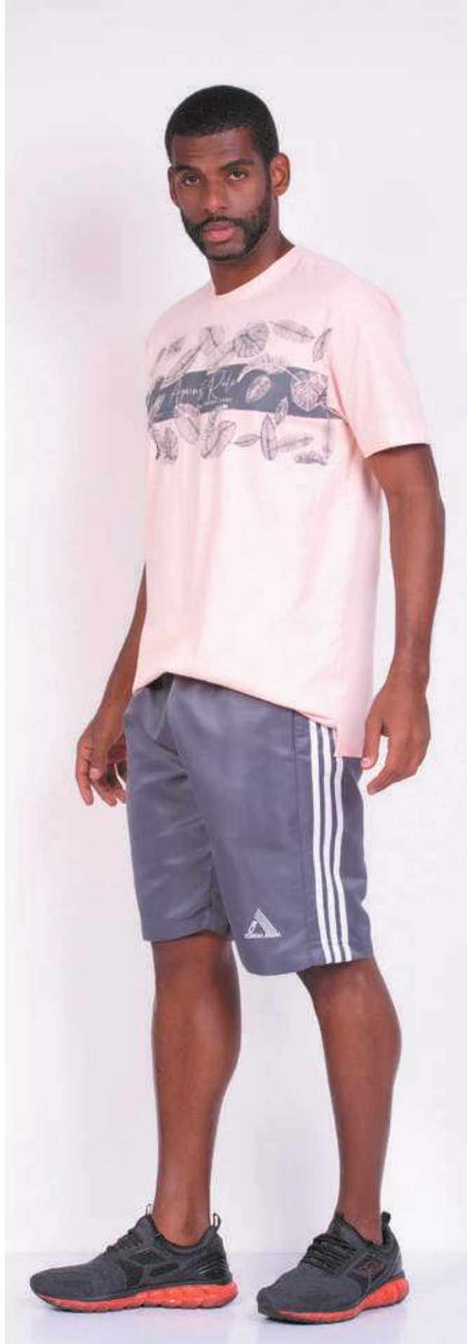
REF. 1569 CAMISETA TRADICIONAL MEIA MALHA 100% ALGODÃO TAM. P AO S5