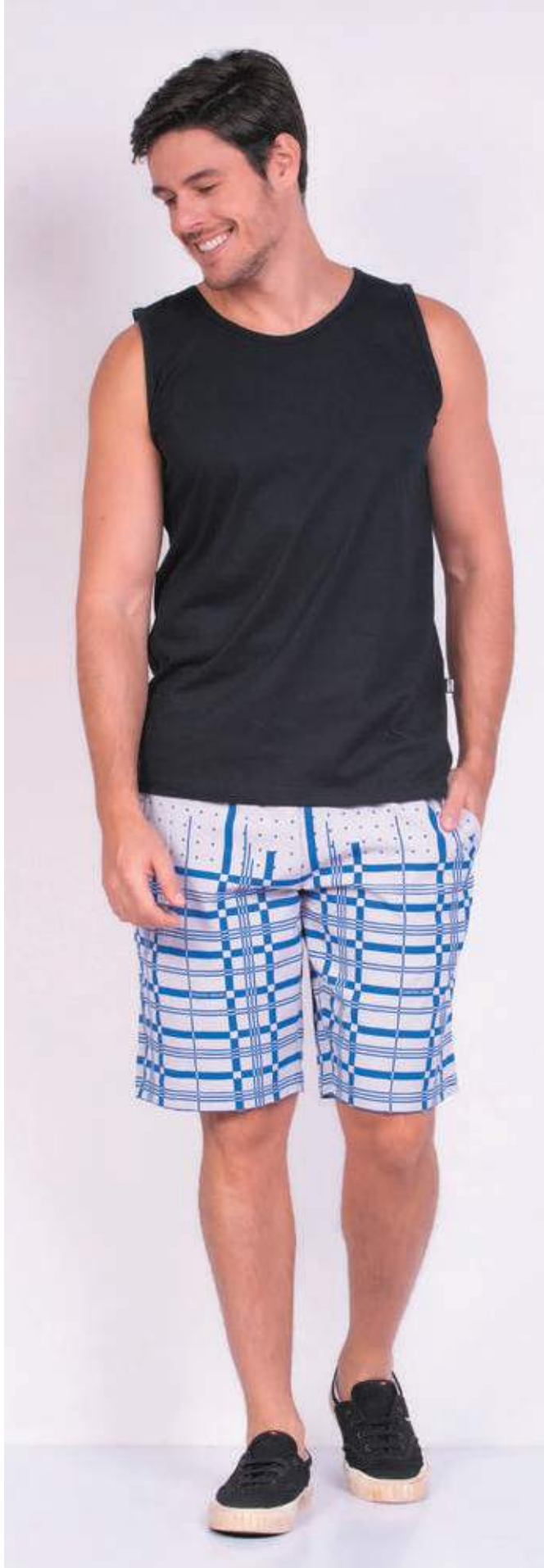
REF. 4422 CAMISETA REGATA TRADICIONAL MEIA MALHA 100% ALGODÃO TAM. P AO S8