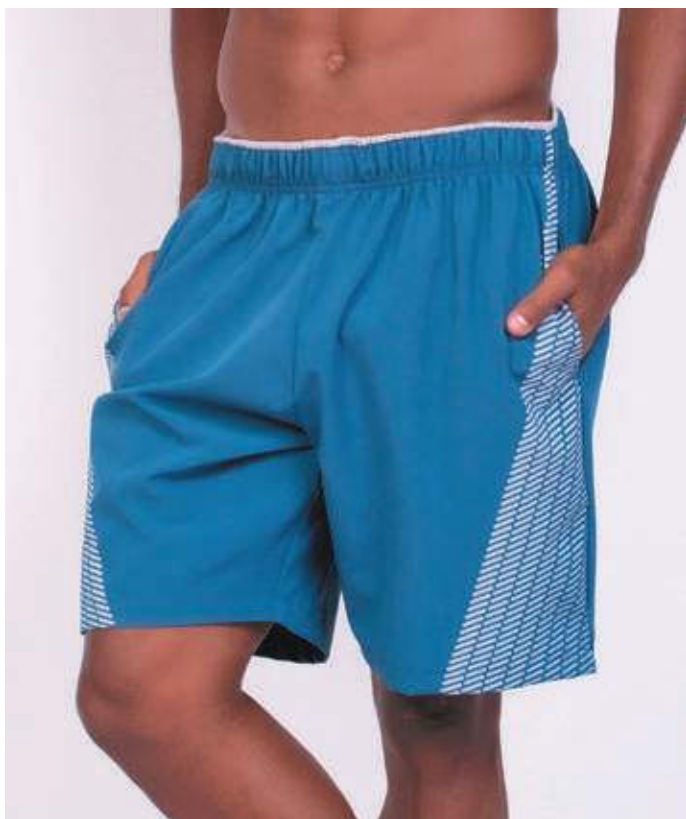
REF. 473 BERMUDA MAIS CURTA DE ELÁSTICO MICRO FIBRA C/ ELASTANO 92% POLIÉSTER 08% ELASTANO TAM. P AO S5