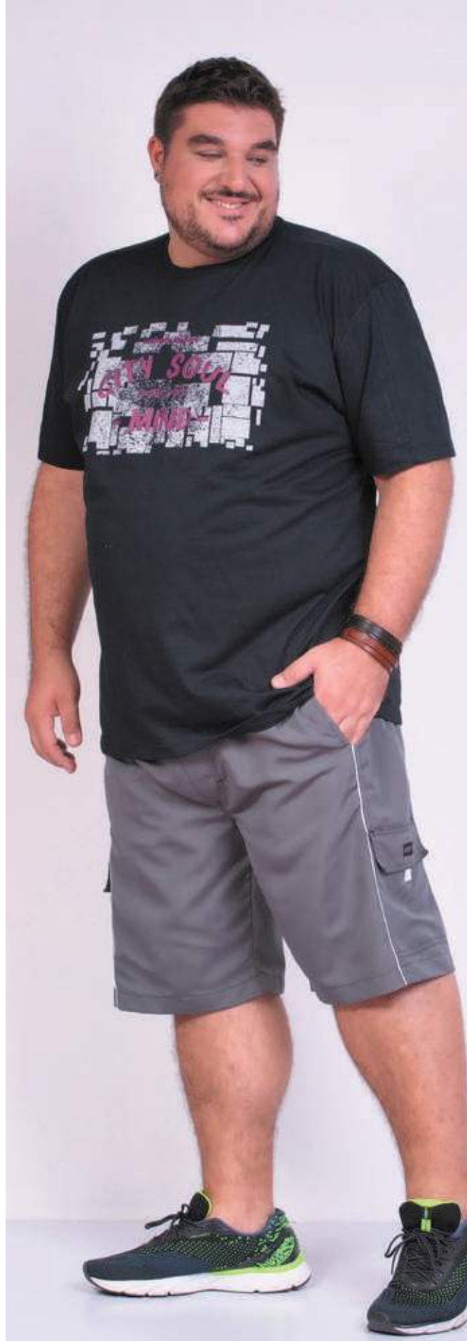
REF. 1548 CAMISETA TRADICIONAL MEIA MALHA 100% ALGODÃO TAM. P AO S8