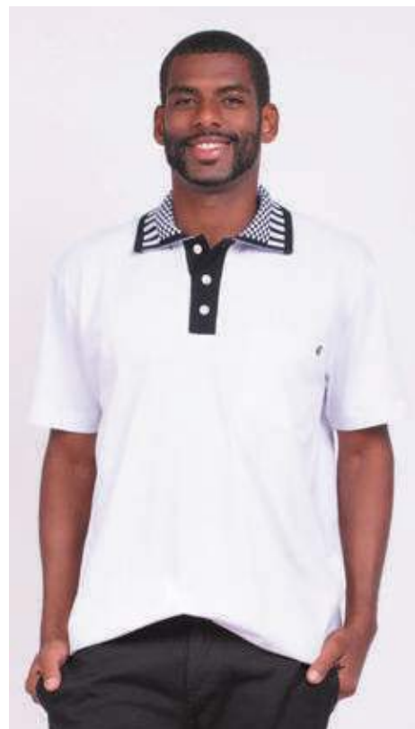
REF. 3379 CAMISETA POLO TRADICIONAL MEIA MALHA 100%ALGODÃO TAM.: P AO S8