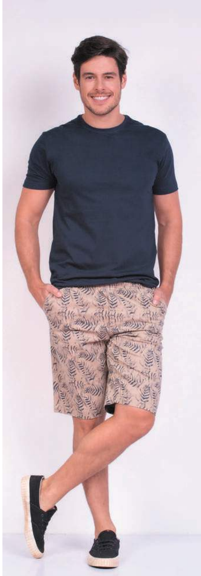
REF. 1220 CAMISETA TRADICIONAL MEIA MALHA 100% ALGODÃO TAM. 04 AO S10