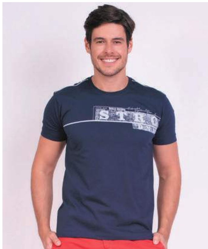
REF. 1575 CAMISETA STREET MEIA MALHA 100% ALGODÃO TAM. P AO GG